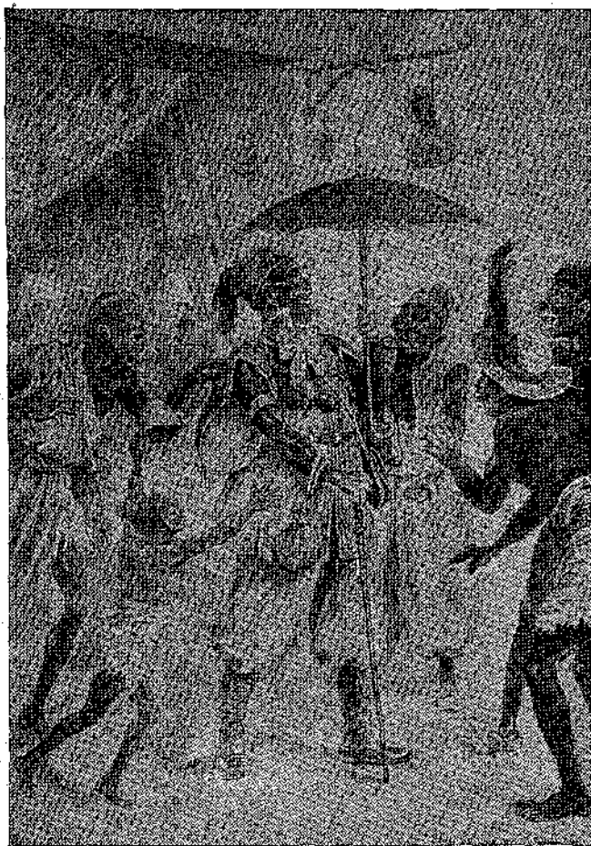
«Ἀμέσως ἓνα μπουλοῦκι ἀπὸ μαῦρους τὸν περιτοχίσα...» (Σελ. 288. στ. 6'.)

Ἐδύχως, ὁ Γιώργος εἶχε πλάι του ἓνα ἄγριον φίλο,