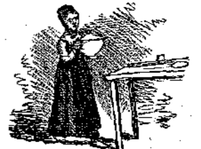
"Ἐφρονε τὸ φῶς σὸν τρα-πέζι..." (Σελ. 245, στ. 5.)

"Ἡ κυρία Φανῆ πὸν τὴν ἔδλεπε ἔτσι μελαγχολικὴ και τὴ λυπόταν, σκέφτηκε πᾶλι νὰ τῆς διασκεδάση τὴ λύπη, νὰ τῆς στρέψῃ τὸ νοῦ σ' ἄλλο πράγμα. Γιὰ νὰ μὴν κἀθετα λοιπὸν νὰ συλλογιέται ὄλη τὴν ὄρα πὸσο ἦταν δυστυχισμένη αὐτὴ και πὸσο εὐτυχισμένα τέλλα παιδιὰ πὸν εἶχαν