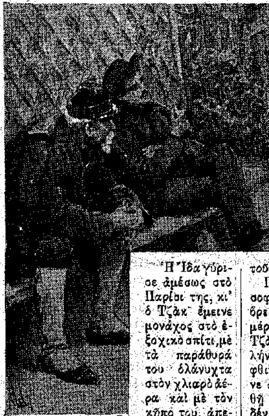
Ἐκάνει τὴν πῖκα του διπλά στὸ θασοφύλακα... (Σελ. 102, στ. α')

Φύση. Μὰ κι' αὐτὴ λὲς καὶ τὸν γινώρισε, καὶ τὸν ἔκραξε, καὶ τὸν δέχθηκε μὲ χαρὰ. Βαθιά στὴν ψυχὴ του, ὁ Τζᾶκ ἄκουγε σὰ μιὰ φωνὴ ποὺ τοῦ ἔλεγε: «Ἐλα σὲ μένα, καιμένο παιδί, ἔλα στὴν ἀγκαλιά μου. Θὰ σὲ ζωογονήσω, θὰ σὲ γιατρέψω. Ἐχω βάλασμα γιὰ κάθε πληγὴ κι' ὅποιος τὰ γυρεύει ἀπὸ μένα, εἶναι κιόλα γιατρεμένος!»