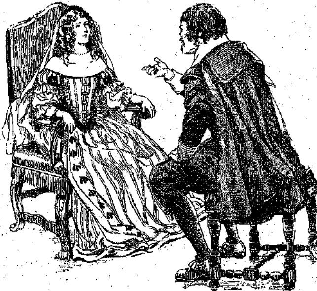
«—Ἐγὼ εἶμαι ὁ ἀφέντης ἐδῶ-μέσα καὶ δὲν ἄννοῦ νὰ τὸ λησμοιοθῶν (Σελ. 294, στ. γ').»