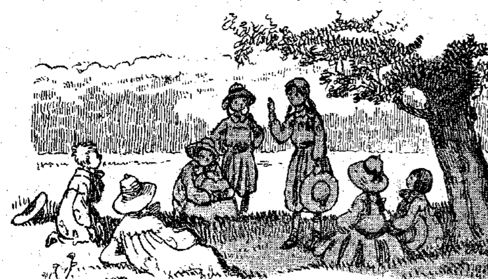
— Ναι, εἶναι πολὺ σοβαρὰ μαλωμένοι... (Σελ. 499, στ. β'.)

χαρισται και τοὺς δύο γέροντες, ποὺ κουρασμένοι ἀπὸ τὴν πνευρηρὴ ζῆστη, ἔχουν χάσει τὴ συνθησιμένη ἐξυδερκεία τους.