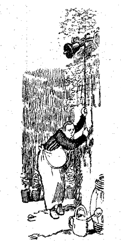
«Τὸ κουδούνι τοῦ φαγητοῦ». (Σελ. 510, στ. γ'.)

γωγὴ τῶν ἀγοριῶν φαίνεται σήμερα πολὺ παράξενη, ἔκανε ἀξάφνα τὴν ἀνακάλυψη ὅτι τὰ μαλλιά τῶν μικρῶν ξένων τους εἶναι ἐξαιρετικὰ σήμερα φουντωτά.