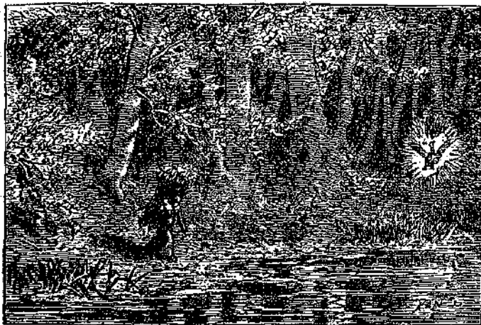
«Εἶδε τὸν κύκνο τῆς εὐτυχίας νὰ βγαίνει ἀπ' τὸ νερό...» (Σελ. 189, στ. β'.)

» Ὁ κύκνος ἔφτασε πάνω σὲ μιά γαλανὴ λίμνη, με ἰτιὲς καὶ σκοῖνα στίς ὀχθὲς τῆς. Ὁ κύκνος κατέθηκε νὰ κολυπήσῃ.