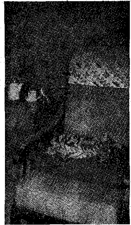
Ἡ πολυθρόνα ὅπου ἀπέθανε ὁ ποιητῆς. μ' ἕνα στεφάνι δάφνης... (Σελ. 541, στ. β')

Τὸ σπίτι τοῦ Γκαίτε διατηρεῖται μὲ πολλὴ προσοχή, καὶ κάθε τόσο, οἱ νεαροὶ γερμανοὶ μαθητῆς πηγαίνουν ἐκεῖ σὰ σὲ προσκύνημα: Καγεῖς δὲν μπορεῖ νὰ μπεῖ μέσα, ἀν δὲ φορέσει εἰδικῆς παντοφλεις, ποὺ δὲ λερώνουν, οὔτε κάνουν θόρυβο. Ἐκεῖ θὰ ἴδουν τὴν πολυθρόνα, ὅπου ἀπέθανε ὁ ποιητῆς, μ' ἕνα στεφάνι δάφνης ἀκουμπισμένο ἐκεῖ ἀκριβῶς