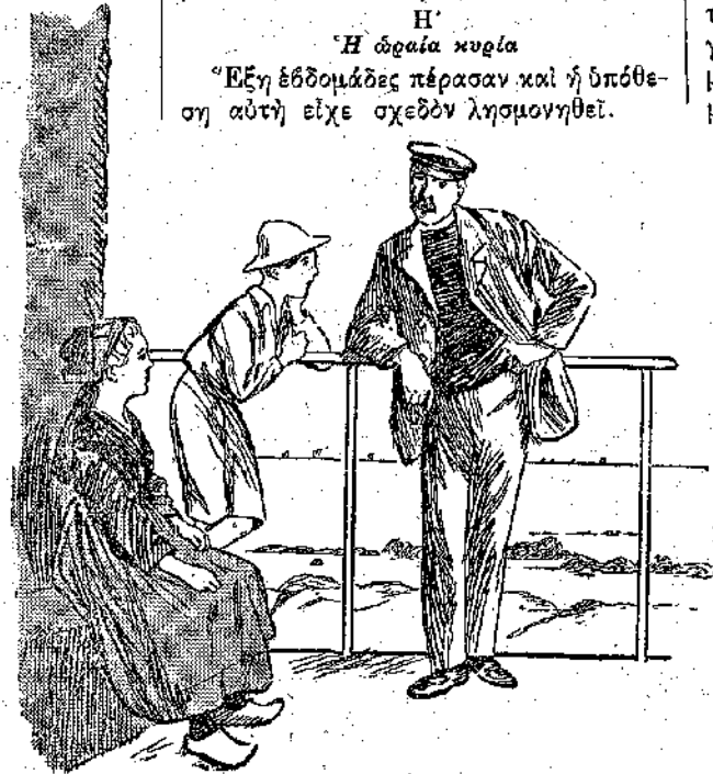
Τα παιδιά άκουγαν καταγοητευμένα το φαρμόφακα...

Έξη εβδομάδες πέρασαν και ή ύπνοση αυτή είχε σχεδόν λησμονηθεί.