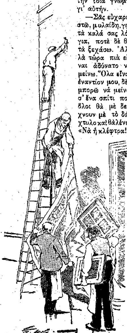
«Οἱ τοῖχοι ντυμένοι μὲ βαρῦτιμα χαλιά...» (Σελ. 212, στ. β')

— Σὰς εὐχαριστῶ, μολαίδη, γιὰ τὰ καλά σὰς λόγια, ποτὲ δὲ θὰ τὰ ξεχάσω. Ἀλλὰ τώρα πιά εἶναι ἀδύνατο νὰ μείνω. Ὅλα εἶναι ἐναντίον μου, δὲν μπορῶ νὰ μείνω σ' ἕνα σπίτι ποὺ ἄλλοι θὰ μὲ δείχνουν μὲ τὸ δάχτυλο καὶ θάλένε: «Νὰ ἡ κλέφτρα!»