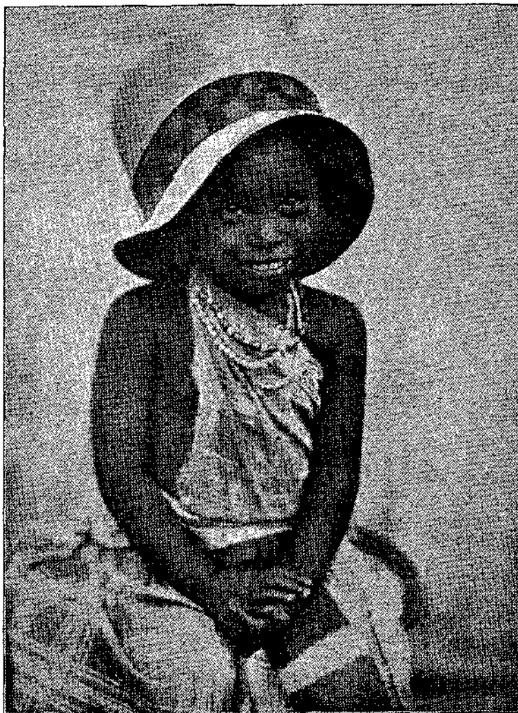
Αὐτὸ τὸ ἀρσάκι. — ἀγορὴ νᾶναι ἡ κορίτσι; — τὸ φωτογράφησαν σ' ἓνα σχολεῖο τῆς Ἀφρικῆς.