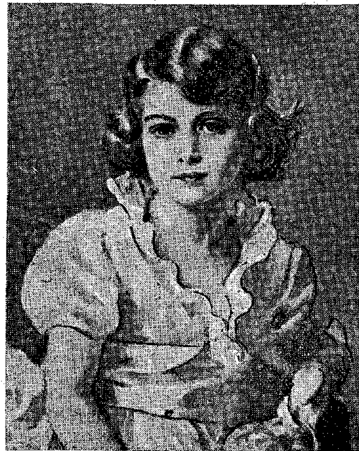
Το κοριτσάκι αυτό είναι το πιδ γνωστό, το πιδ όμορφο, το πιδ αγαπητό κι' ίσως το πιδ εύτυχισμένο του κόσμου. Είναι ή Έλισάβετ, πρωτότοκη κόρη του δουκός της Υόρκης και τώρα διαδόχου του Άγγλικού θρόνου, ή μέλλουσα δηλαδή Βασίλισσα της Άγγλίας και Αυτοκρατορίσσα των Ινδιών!