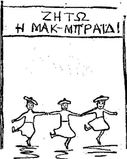
«Κουβαλούσαμε στην παρέλασή μας πελώριες επιγραφές στημένες επάνω σε κοντάρια...» (Σελ. 189, στ. α')