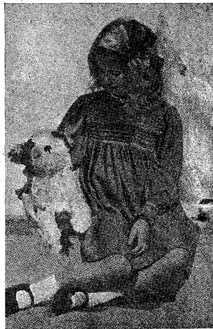
— Άς είναι ψεύτικος ο Μπόμπης μου, εγώ τον αγαπώ!