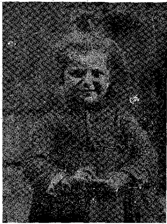
Μιά χαριτωμένη γερμανίδα χωματοπούλα μ' ένα πτό χαριτωμένο κότσο στην κορφή του κεφαλιού!

νος να χασομερήση τόσο καιρό! Μά κι' ο Ζαμπούκο, κι' ο Όμάρ, κι' ο Σαούκ, δεν φαίνονταν λιγώτερα φουρισμένοι. Όσο για τόν Ζιλδα και τόν Ζυχέλ, που δεν τούς ένοιαζε για το θησαυρό, ήταν στενοχωρημένοι μόνο που θάρχουσε ο γυρισμός τους στη Γαλλία.