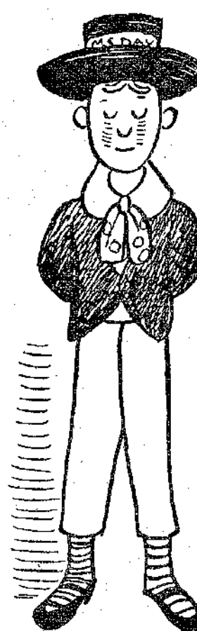
«Αὐτός, ὁ ἅγιος Ὀνούφριος...» (σελ. 7, στ. γ')