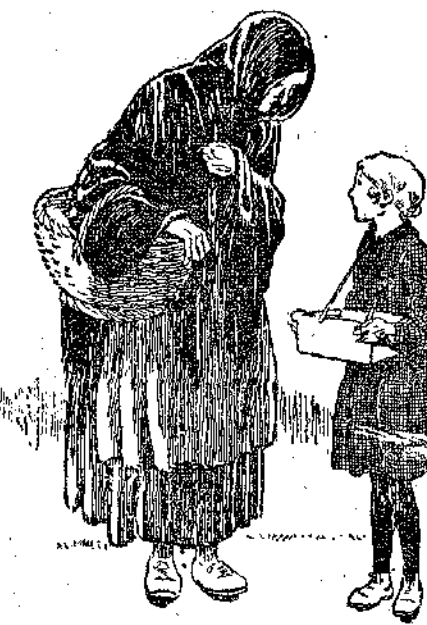
— Σὲ λένε Ἀνναμπέλλα, δὲν εἶν' ἔτσι; (Σελ. 1, στ. γ')

Ὁ Ρικάρντο ἀκούμπησε χάμω τίς ἐφημερίδες του.