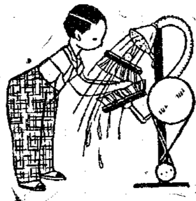
Είναι ένα μηχάνημα εξαιρετικά έξυπνο!