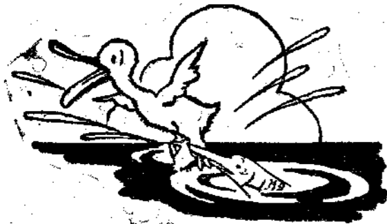
Πεταχτηκε ένας θεόψαρος και την άρπαξ' απ' το πόδι.

Ακούστε λοιπόν τι διηγήθηκε ο καθηγητής δ κ. Δεζέ στην επιστημονική Λέσχη της Γρενόβλης: Πρώτα πρώτα λοιπόν σε μια άκρογιαλιά μια αγριόπαπια πήγε να τιμπήση καμμιά μαριδούλα και πετάχτηκε από το νερό ένας θεόψαρος και την άρπαξε από τον πόδι και μόλις κατάφερε να γλυτώσει. Πάνω από μια λίμνη πετούσε ένα γεράκι, όταν εξαφανα αντίκρουσε μια πέστροφα που είχε ανεβή στον άφρο για να λιαστή, καθώς φαίνεται. Στη