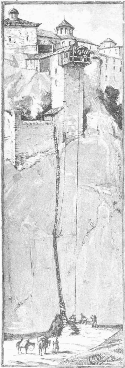
ΑΝΑΒΑΣΙΣ ΕΙΣ ΤΗΝ ΜΕΤΑΜΟΡΦΩΣΙΝ

αἰνοῦσι τὰ στέρα. Ἐπὶ τῆς κορυφῆς τῶν ἀπροσιτωτέρων ἐκ τῶν φυσικῶν τούτων στόλων ἐκτί-