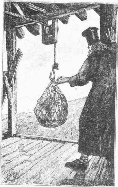
ΠΑΡΑΛΑΒΗ ΤΟΥ ΔΙΚΤΥΟΥ

νων Ἀγγλων περιηγητῶν, ἐβεβαίωσεν ὅτι εἶνε διακοσίων πενήκοντα τοδῶν. Ἡ αἰσθησις δὲν εἶνε δυσάρεστος, καὶ τόσον δυνατὴν εἶνε τὸ σκονίον, ὥστε ἀπελάυνει πάντα φέρον δυστιχήματος· ἀλλ' ὅταν περιτυλιχθῇ ὅλον εἰς τὸν ἐργάτην καὶ ἀγίση ν' ἀποτελῇ ἄλλον κύλινδρον, οὗ ἔρχεται ἡ ψυχὴ εἰς τὸ στόμα, ἀναλογιζομένου πῶς ἐντὶς