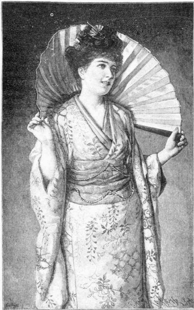
ΤΟ ΑΝΘΟΣ ΤΗΣ ΙΑΠΩΝΙΑΣ

Ἐάν κατὰ τὸ θέρος δυσανασχετώμεν ἕνεκα τῆς θερμότητος, πλουσιοπαρόχος ὠφελούμεθα τοῦλάχιστον ἀπὸ τὴν ἐργασίαν τῶν ἡλιακῶν ἀκτίνων, προσφέρουσαν ἡμῖν ἄρτον καὶ κρέας. Καὶ ὁ οἶνος, τὸν ὁποῖον τὸ φθινόπωρον ὠρίμασε, μᾶς δίδει πάλιν τὴν θερμότητα τῶν ἀκτίνων τοῦ ἡλίου. Τὸ ἔλαιον, δι' οὗ φωτίζομεν τὸ δωμάτιον, εἶναι ἡλιακὸν φῶς πάλιν ακτινοβολοῦν, τὸ ὁποῖον ἄλλοτε ἐπλήρωσε τὰ κύτταρα τοῦ καρποῦ τῆς ἐλαίας μὲ καύσιμον οὐσίαν. Καὶ ὅταν θερμαίνωμεν τὸ δωμάτιον μὲ ξύλα, ἀπολαμβάνομεν τῆς θερμότητος, τὴν ὁποῖαν αἱ ἡλιακαὶ ακτίνες κατὰ τὸ διάστημα πολλῶν ἐτῶν συνεκέντρωσαν εἰς τὰ δένδρα τοῦ δάσους.