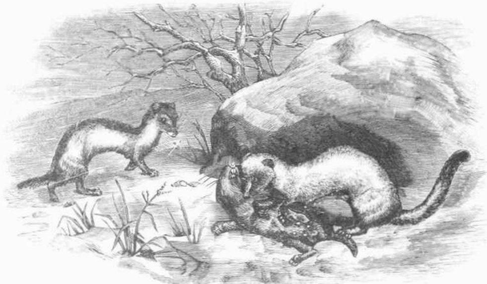
Ἐομιλίην κατὰ τὸν χειμῶνα

ἄλλας μεθόδους ὅταν συλλεθῆσι ἀρεθῇ ἐπὶ τῆς ἀκτῆς, λαμβάνει αἰθέσις διὰ τῶν κοτυληθῶν τῶν βραχιόνων τοῦ μικροῦ λίθου καὶ καλύπτεται δι' αὐτῶν τόσον καλῶς, ὥστε ἀλειεῖ καὶ φουσιδεῖται δύνανται νὰ διέλθωσι πρὸ αὐτοῦ καὶ νὰ μὴ