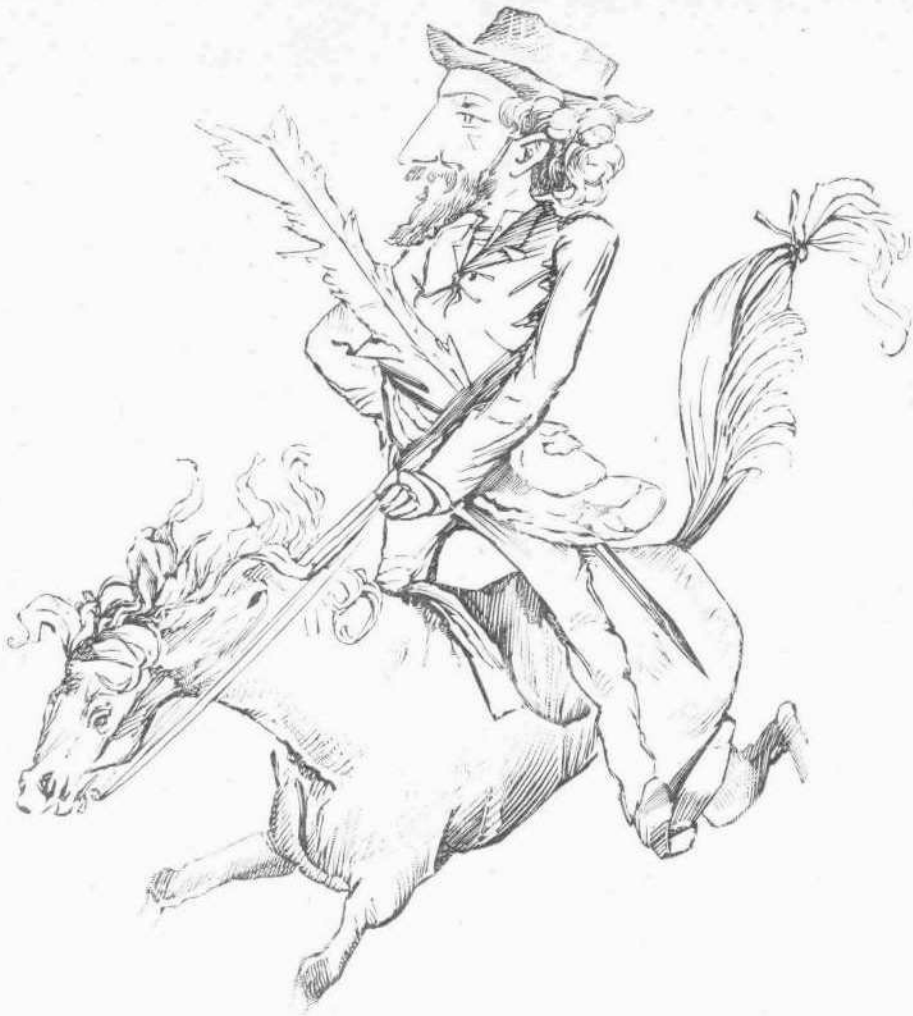
Ο ΣΟΥΡΗΣ Κατά γεωγραφίαν Θέμου Ἀρνίνου.

τοῦτο αἰγυπτιακῆς ὑποθέσεως τοῦ γ' αἰῶνος μ. Χ. ἤ- τοι τῶν χρόνων τοῦ Καρακάλλα. Τὸ ἔργον τοῦτο εἶνε δίτομον καὶ ἐπιγράφεται «Per aspera».