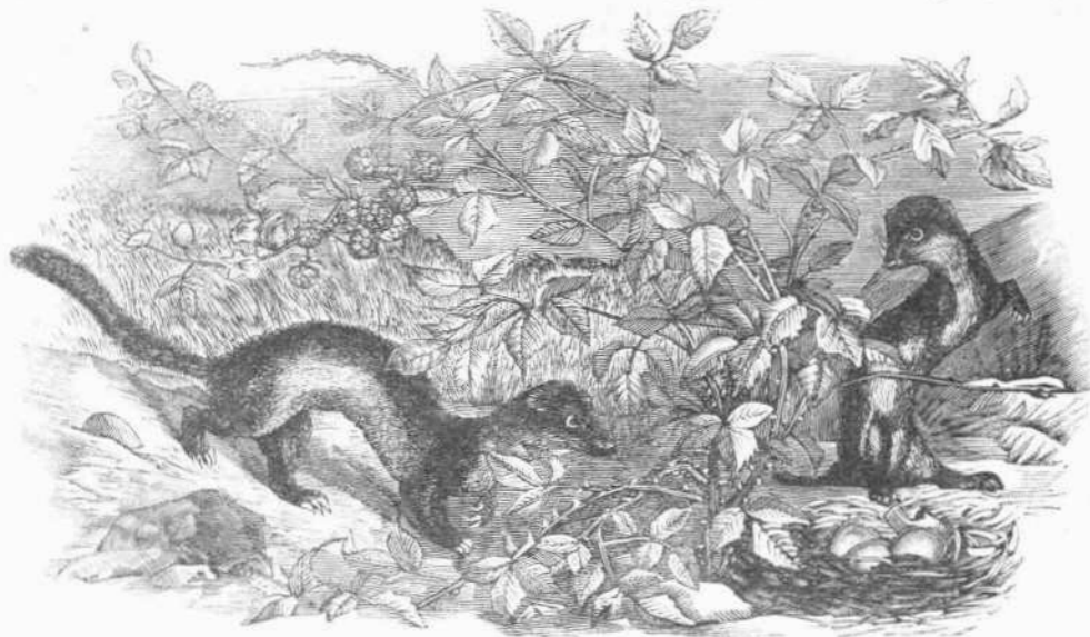
Ἐομιλίην κατὰ τὸ θέρος

Ἀπομίμησις ἰκονοσία. Ὁ δακτάπους ἔχει καὶ