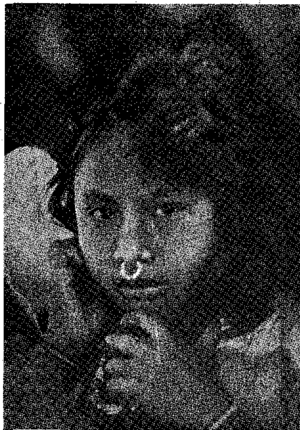
Μικρὴ Ἰνδιὰνα μὲ τὸν ἀγαπημένο της πίθηκο. Ἀνεκοινώθη ἀπὸ τὴν Ροζελάντια