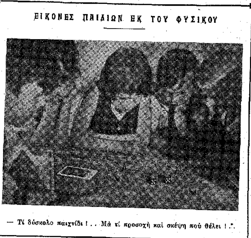
— Τι δύσκολο παιχνίδι!.. Μα τί προσοχή και σκέψη που θέλει!..

και αλατισμένα. Τριάντα τόννοι άλάτι είναι μέσα στο μπροστινό άμπαρι και για την ώρα ίσα-ίσα που σκεπάσαμε τις βέργες μας!)