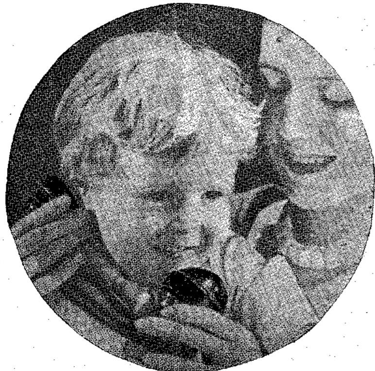
Πρώτη τηλεφωνική επικοινωνία του Μπέμπη με τον πατέρα του: «'Εσύ 'σαι, μπαμπά;... Μπα, μπα, μπα!...»