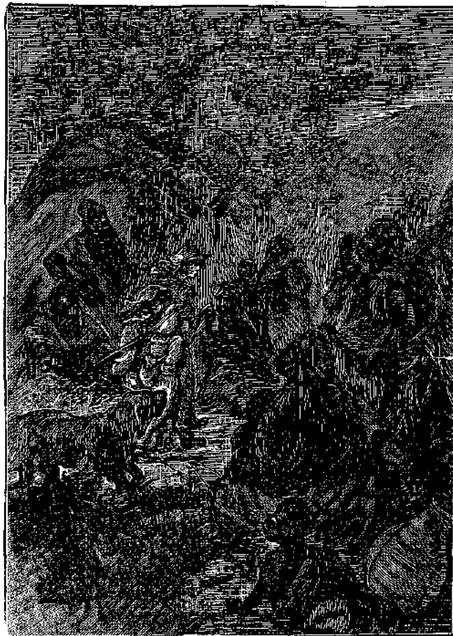
«Παραπλανήθηκαν καὶ βρέθηκαν σ' ἕνα χωριὸ μαύρον» (Σελ. 254, στ. α')

Καὶ βέβαια ποῦ οἱ δυὸ μέρες δὲν ἦσαν καὶ σπου- δαῖο πράγμα. Ἀφοῦ μάλι- στα ὁ θεῖος τους θὰ γύριζε μεθαύριο στὴν Βάτνα, οὔτε λόγος πὼς ἔπρεπε νὰ τὸν περιμένουν ἐκεῖ. Γιατὶ ἂν ἐπιχειροῦσαν νὰ πᾶνε νὰ τὸν