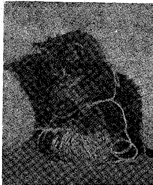
— Καὶ τώρα νὰ ἰδῶ πὼς θὰ βγῶ ἀπὸ δῶ μέσα... Ἀνεκρινώθη ἀπὸ τὴν Ροζελάντια

Ἡ οἱ στρατιῶτες θ' ἀντάμωσαν τὸν θεῖο Θωμᾶ, ποὺ ἄμα ἔμαθε πὼς τὸν ζητοῦν τ' ἀνίψια του θὰ τὰ παράτησε ὅλα καὶ θὰ ἐτρέχε νὰ τὰ εἴρῃ ἢ ὁ θεῖος τους δὲν ἦταν πιά στὸ Βοῦ Ἰζέλ καὶ ὁ καπετὰν Χαροῦρ ἐγύρισε στὴ Βίσκρα ἀπὸ τὸν πιδ σύγτομο δρόμο. Ὅπως ὅμως καὶ ἂν εἶχε τὸ πρᾶγμα, τὰ παιδιά θὰ ἔπρεπε νὰ συναντήσουν ἢ τοὺς δύο στρατιῶ-