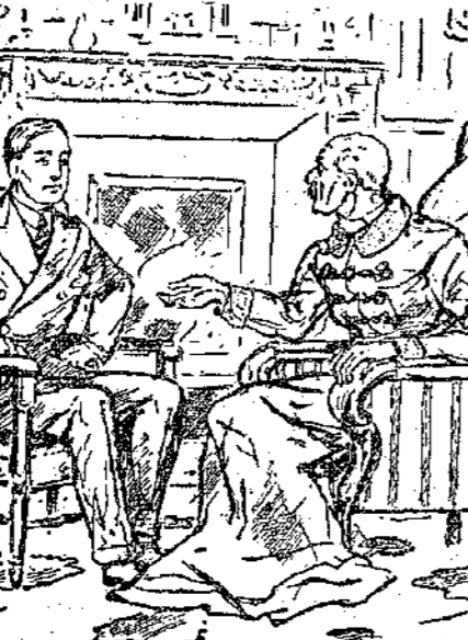
— Καρμικσαλ, σ'όποι να τήν βρω ! είπε ο κ' Καρμφορδ (Σελ. 328, στ. γ')

τό σωμα όποφέρει πρέπει νά αναγκάζη κανείς τó μυαλό του νά άπασχολεείται με κάτι άλλο. — Τό κατορθώνεται, σ'εις αυτό, μίς; φηθύρισε ή Μπέκυ κοιτάζοντας τήν με θαυμασμό. "Η Σάρα ζάρωσε τά φρύδια της κι' έμεινε για μιά στιγμή σιωπηλή. — "Αλλοτε ναί και άλλοτε όχι,