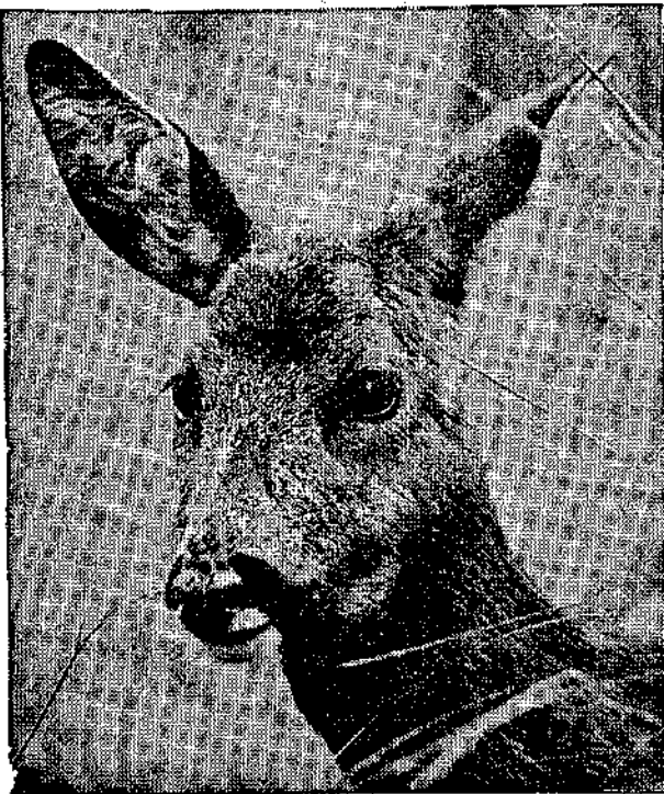
"Ένα ώραίο ζαρκάδκι

γιο-Βασίλης — πού νάρθη ό καυμένος από τόσο μακρυά — ξέρεις πού είναι ή Καισαρεία; . . από τόσο πρωτ. Μά θάρθη, Σπυράκη, θάρθη. . . — Καλά τις άλλες χρονιές, πώς έρχόταν πρωτ-πρωτ; Δέν κρύωνα τότε; — Όχι τόσο Σπυράκη, όχι τόσο. Θυμάσαι άλλες χρονιές να είδες χιόνι; — Έτσι τó λένε τó μπαμπάκι τούδρανό — χιόνι — από τότε πού είσαι μαζί μας Σπυράκη; — Όχι ό Σπυράκης δέ θυμάται. Έβρω