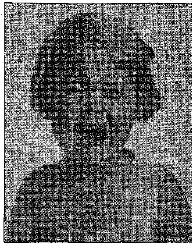
Τί εσχημη πού γίνεται ή Μπέμπα όταν κλαίῃ! . .

Τά έλεγε γελώντας, αλλά στό βάθος τής καρδιάς της είχε μιá μικρή έλπίδα πού έδινε μιá παράξενη λάμψη στα μάτια της κι' ένα περίεργο τόνο στή φωνή της. "Έτσι ή Ερμίνα, μ' έλο πού δέν είχε ιδέα γιατί τής μιλούσε ή Σάρα τήν άκλόβητησε τρέμοντας από ταρραχή και άνοσημονησία, γιατί φανταζόταν πώς πούς ξέρει τί θ' αντίκρουζαν τά μάτια της. Πλησίασαν λοιπόν στίς μύτες τών ποδιών κι' ή Σάρα άνοιξε ξαφνικά τήν πόρτα. Στά μάτια τους παρουσιάστηκε ή κάμαρα άδειανή και καλοσυγυρισμένη. Μιá λαμπρή φωτιά έκαιγε στό τζάκι, και κοντά, σ' ένα καρεκλάκι, καθόταν μιá κούκλα πού έμοιαζε να διαβάζῃ.