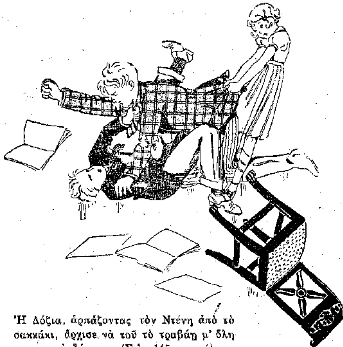
Ἡ Δόζια, ἀρπάξοντας τὸν Ντένη ἀπὸ τὸ σακκάκι, ἀρχισε νὰ τοῦ τὸ τραβάῃ μ' ὅλη τῆς τὴ δύναμη. (Σελ. 145, στ. γ).

Ὁ Ντένης ἀπράγμῃς πρὸς τὸ μέ- ρος τῆς ἀπειλητικὸς καὶ ἀγριος.