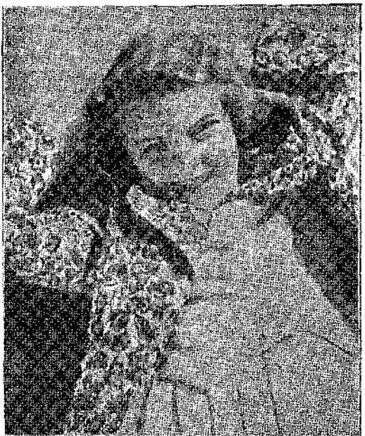
— Πῶς χαίρομαι ποὺ ἦρθε ἡ Ἄνοιξη καὶ κοιντενεῖ τὸ Πάσχα! Μὰ καὶ ποὺ νικᾶμε!... Ἄνεκινώθη ἀπὸ τὸν Μπετόβεν

ἀμμουδιὰς γιὰ νὰ πάρω ἓνα ἡλιόλουτρο καὶ συγχρόνως νὰ στεγνώσω. «Ἀνακάλυψα τὴν πηγὴ τοῦ Μεγάλου Λαμπόνγκο, σκεπτόμουν. Θὰ τὸ γράψω στὴ Βασιλικὴ Γεωγραφικὴ Ἐταιρεία γιὰ νὰ μοῦ στείλουν τὸ μετᾶλλιο».