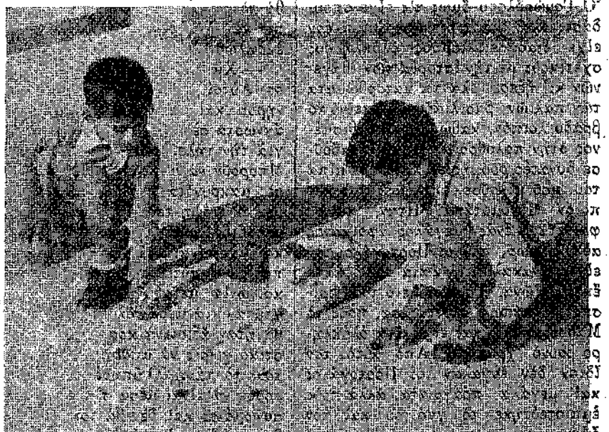
Ἐνα παιχνίδι βόλοι ἀπὸ τὸν ἕνθον, ποῦ τὸ παρακολοῦθει μὲ προσοχή καὶ τὴν ἀποφασὴν τοῦ ἕνθον.