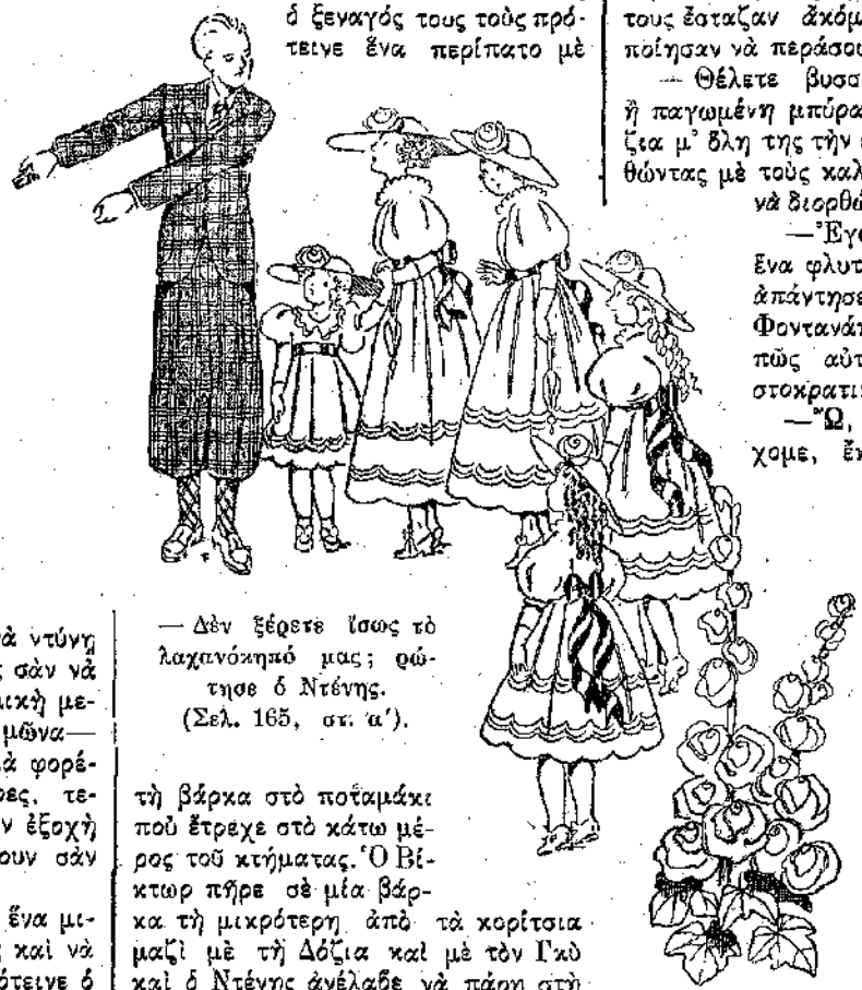
— Δὲν ξέρετε ἔλας τὸ λαχανόκηπό μας ; ρώτησε ὁ Ντένης. (Σελ. 165, στ. α').

Τὰ Φοντανάκια, ἡ μιά πίσω ἀπὸ τὴν ἄλλη ἔτρεχαν λαχανιασμένες ἀπὸ πίσω του. Στὸ τέλος ὁ ξαναγός τους τοὺς πρότεινε ἕνα περίπατο με