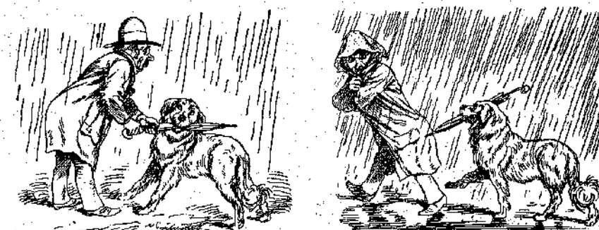
έδωσε στή δρόμο και τήν ομπρέλλα τήν. Έξαφνα άρχισε να φεραλίξη. Ο κύριος θέλησε να τήν πάρη. "Αδύνατο να τήν άφήση ή "Ατό! Σε λίγο έπιασε βροχή σαφάια. Κι' ή κύριος τήν έφαγε όλη, ενώ ή σκύλος τήν τόν ακολουθούσε, κρατώντας τήν ομπρέλλα τήν... με καμάρι!