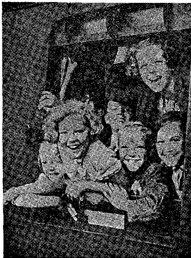
— Πᾶς στὴν ἐξοχή! Ζήτωσω! Ἀνεκινώθη ἀπὸ τὸ Αἶλν Ἀριστεῖν