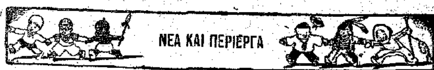
ΝΕΑ ΚΑΙ ΠΕΡΙΕΡΓΑ

Ένα όνειρο — το μεγαλύτερο — δεν κρατάει περισσότερο από τρία δευτερόλεπτα. Κι δταν ακόμα βλέπουμε πώς ταξιδεύουμε, δτι το καράβι μας πνίγεται, ή ότι πάμε στον κινηματογράφο, ή ότι μάς κνηγοούν κ. λ. κ. δλ' αυτά μπορεί να μην κρατήσαν παρά μονάχα ένα δευτερόλεπτο. Κι δμως, δταν ξυπνήσουμε, έχουμε την εντύπωση ότι όνειρεύομαστε δλόκληρη τη νύχτα.