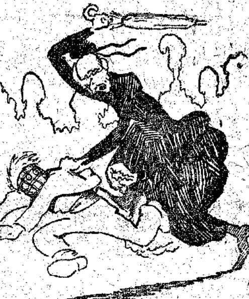
Μας άρχισε με την όμφάλλα.

Έγώ όμως δεν ήθελα να διακινδυνέψω την έλευθερία μάς και να ξυπνήσω το μαύρο. Θα πατούσε τις φωνές και σίγουρα θα μάς έπαιρναν είδηση από το σπίτι. Άλλωστε την εκδίκηση μάς μπορούσαμε να την πάρουμε άλλη φορά. Θα μάς δινώταν βέβαια κάποτε ή δικαιορία. Και στο κάτω-κάτω, ο Τζιμ, έκανε το καθήκον του φυλάγοντας το σπίτι από τους κλέφτες. Γιατί λοιπόν να τον δέσουμε;