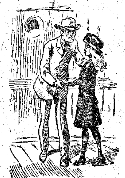
"Ελα, μικρή Μιμόζα.

"Όλα αυτά ή Μιμόζα τα έαίσθα- νόταν, τα καταλάβαινε καλύτερα από κάθε άλλον. Μήπως δεν ήταν κι' αυτή ένα μικρό λουλούδι των έρη- πίων; Δεν είχε δει κι' αυτή να φεύ- γουν από τη ζωή ή μητέρα της κι' ο πατέρας της; Εύτυχισμένη, ά, εύ- τυχημένη ήταν να έχει το δέξιμο, την προστασία, την άγάπη αυτού του άγνωστου θείου, που τόσο γρή- γορα της είχε άνοιξει την άγκαλιά. Τότε, γλυκά, τρυφερά, σηκώνοντας ως τα χείλη της το ισχνό χέρι που κρατούσε το δικό της, του άπόθεσε