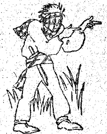
Το πορτοφόλι σου ή τη ζωή σου

— Μπα! έκανε ο Τόμ, θα νομίζουν πως έχεις σκαρφαλώσει σε κανένα δέντρο. Άλλως τε αν υπάρχει κανείς ανάμεσα μας που φοβάται, είναι ελεύθερος να φύγει. Μια και