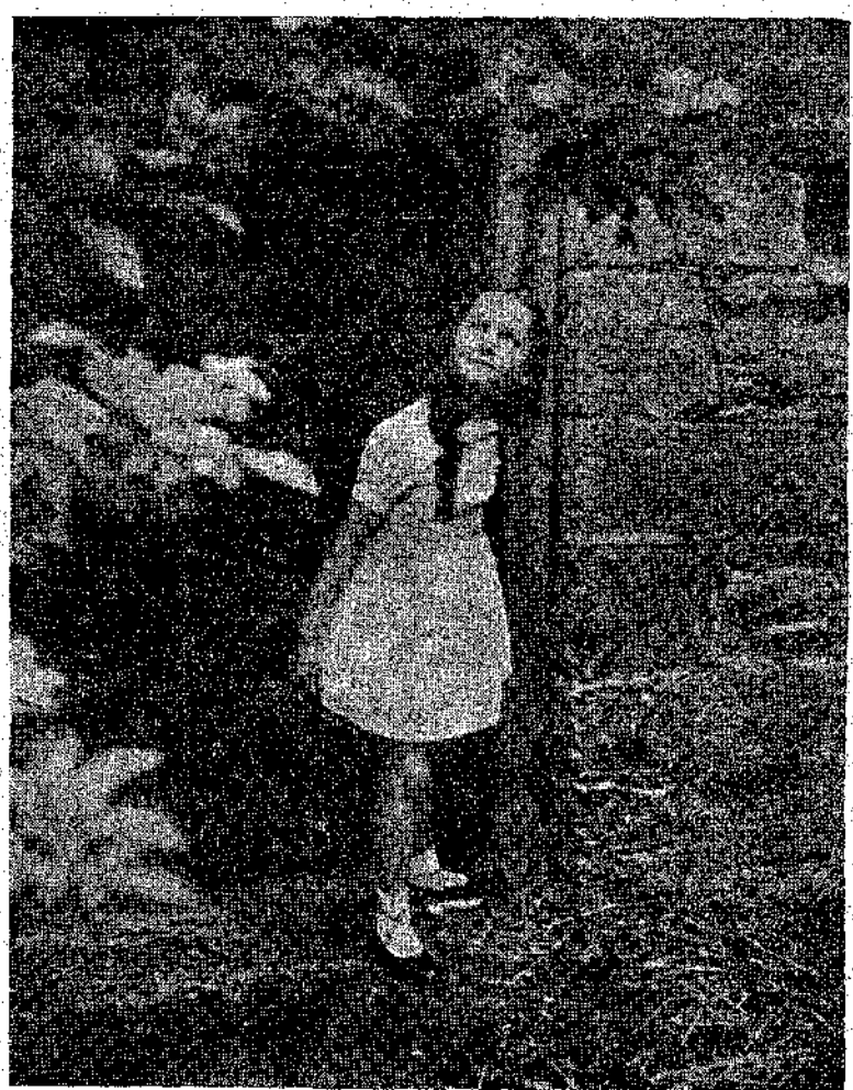
Χαιρετισμός στον ήλιο της Πρωτοχρονιάς.

διακρίνω άμέσως ό- λον, το παράθυρο άπέναντι ήταν κα- τάκλειστο, τίποτα δέ με βοηθούσε, μού φάνηκε πως το σκο- τάδι του προχωρού- σε πολύ πέρα. Ήξε- ρα πού, παιδί, μού έδινε την έντύπωση του άπέραντου, θυ- μόμηναι ακόμα που πολύ πιο μικρός, δεν τά κατάφερα, κα- θώς μού διηγούνταν αργότερα, να διανύ- σω όλο το διάστημα και σταματούσα στη μέση. Προχώρησα με περσιότση. Δεν είχα περκατήσει πα- ρά λιγιστά βήματα, όταν άγγιξα το περ- βάσι του άπέναντι παραθύρου. Πώς μού φάνηκε! "Άνοιγα μιά-μιά τις έρημες κάμαρες, πήγα ν' ανέβω και τη σκάλα που ανε- βάσει στο άπάνω πά- τωμα. Οι παραμι- κροί ήχοι αντίλαλου- σαν, μεγάλωναν. Πώς έρημώθηκε έτσι το μεγάλο σπι- τι. Το είχα φαντα- σαστεί άδειο και σκοτεινό, όμως ή- ταν άλλο να το