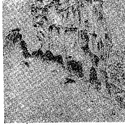
Μετέωρα Σκίτσο του Διστ