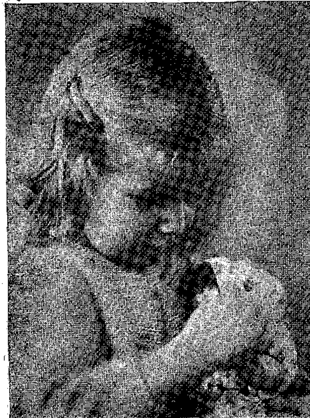
Δὲν σημαίνει ἂν τὸ σκελίκι τῆς Μπεμπέας εἶναι ψεύτικο· τὸ ἀγαπᾶ σὰν ἀληθινόν.