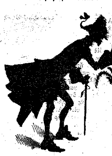
— Ω, τί όμορφο γατάκι! Τί χαριτωμένο γατάκι!