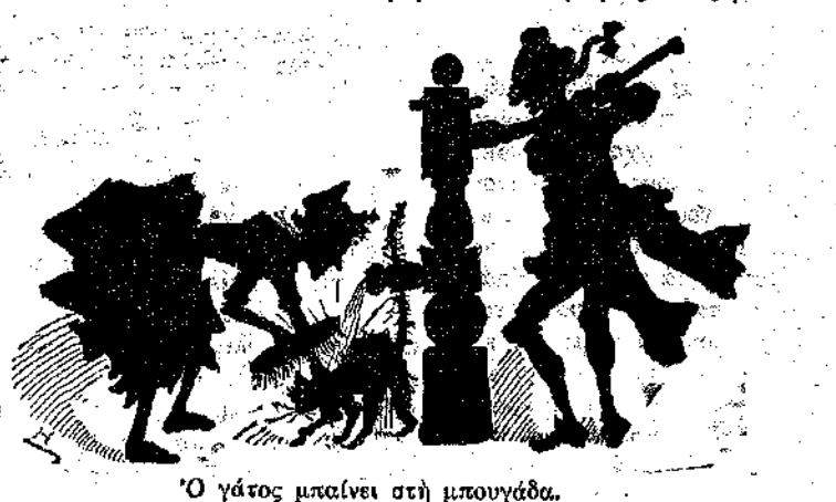
Ο γάτος μπαίνει στην μπουγάδα.

Μην πιστεύεις πώς οι νεκροί πεθαίνουν. Όσο υπάρχουν ζωντανοί, Οι νεκροί θα ζούν, οι νεκροί θα ζούν.