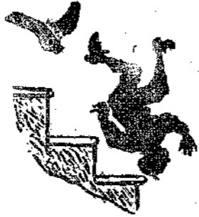
Ο κύρ-Μαθιός πέταξε τον Σβούρα από τη σκάλα.

Την ίδια μέρα η κοντέσσα έγραψε σ' ένα διάσημο χημικό στέλλοντάς του και λίγο άπό τον κιμά. Έκείνος έκανε άμέσως χημική ανάλυση κι' εδήλωσε πως είχε μέσα ποντικοφάρμακο σε τρομακτική δόση.