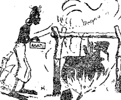
Ο κυρ-Μαθιός φαγώθηκε άπό τους Καννιβάλους της Πολυνησίας.

Οι έγκληματικές προθέσεις του κύρ Μαθιού ήταν πια ολοφάνερες, μα δεν άρρησαν να παρουσιασθούν και ένα πλήθος άλλα επιβαρυντικά. Η περιπέτεια του κύρ Κερακλούρη και του συντρόφου του είχε γίνει γνωστή στους βρακάρηδες του Σηκούανα. Ο Σβούρας την άκουσε τυχαία άπό έναν άπ' αυτούς και κατά-