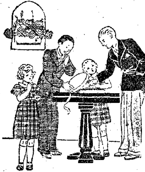
Τά παιδιά ρίχτηκαν στις σοκολάτες.