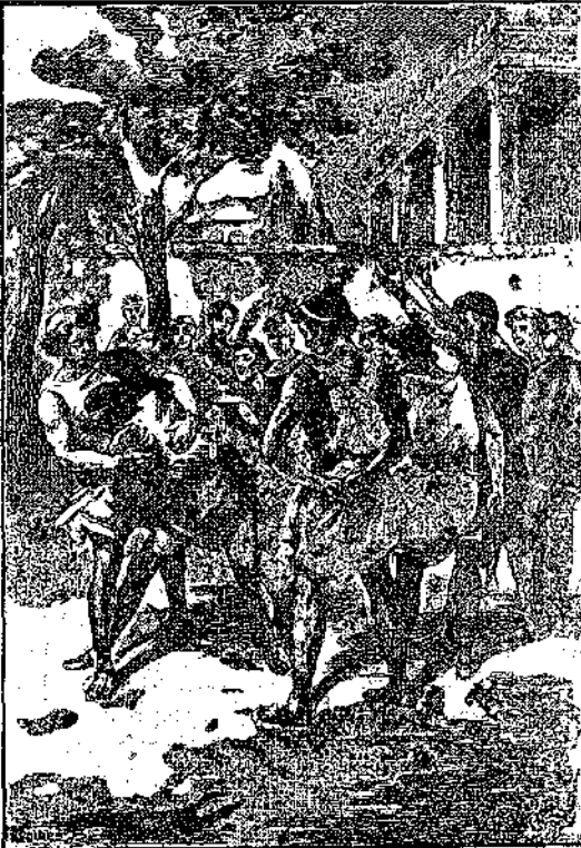
Οἱ δύο ἀντίκαλοι παλαίωσαν λίγες στιγμὲς σιωπηλοί...

τερο ἀπ' ὅ,τι θὰ ἔβλεπες ἐσὺ ἂν ἤσουνα σιτὴ θέση μου! ἀποκρίθηκα ζωνηρά. Τί σημασία ἔχει ἡ ὅλη ἀφοῦ ἡ ἐργασία εἶνε ὠραία! — Μὲ κάνεις νὰ γελοῖ! Μάθε φίλε ὅτι μονάχα οἱ πολῦτιμοι λίθοι πού σκεπάζουν τὸ ἀγαλμα στοιχίζου ἐκατομμύρια ὀλόκληρα ταλάντων... — Ναί' ἀλλ' ὁ Πρόσας ἔχει δίκιο, διέκοψε ὁ Εἰδοφρίων. Ὁ Δεωκράτης ἑκατοντάδες φορές εἶπε μπροστὰ μου ὅτι τὸ ἀγαλματάκι αὐτὸ θὰ τοῦ ἦτανε καὶ πάλι πολῦτιμο, κι' ἂν ἀκόμα ἦτανε σκαλισμένο πάνω σὲ χονδροειδὲς ξύλο, φτάνει νὰ τὸ ἐφτιαχῆ τὸ θεϊκὸ χέρι τοῦ Φειδία. Τὴν ἀξία του δὲν τὴν κάνει οὔτε τὸ χρυσάφι του, οὔτε τὰ μαργαριτάρια του, ἀλλ' ἡ τέχνη τοῦ ἀθάνατου διδασκάλου. — Αὐτὸ δὲν μ' ἐμποδίζει νὰ τὸν ἀγαπῶ καλύτερα καθὼς εἶναι, εἶπε ὁ Μενεκράτης, καὶ νὰ εἶσαι βέβαιος πὺς κατὰ βάθος κι' ὁ Δεωκράτης σκέπτεται σάν καὶ μένα! — Ὁ Δεωκράτης κατέχει πολὺ ὠραία ἀντικείμενα, γιὰ νὰ περιφρονεῖ μερικὰ μαργαριτάρια καὶ μερικὰ διαμάντια, ἀποκρίθηκε ὁ Εἰδοφρίων. Λατρεύει τὸ ὠραῖο κι' ἀδιαφορεῖ ἀπὸ τί δλικὸ εἶνε φτιαγμένο. Ὁ Μενεκράτης χαμογέλασε, ἀλλὰ δὲν ἔβγαλε κουβέντα. Ἐγὼ δὲ ἐξακολούθησα νὰ μένω ἐκστατικὸς μπρὸς στὸ μικρὸ Ποσειδῶνα. — Πὺς ἤθελα νὰ τὸ εἶλεπε ἡ Γλυκερά, φώναξα. Πὺς θὰ τὸ θάμαζες! Ποῦθ θὰ ἐπιθυμοῦσα νὰ τῆς τὸ εἰδείνα. Τὴ στιγμὴ ἐκείνη μπῆκε ἕνας δοῦλος ζητώντας τὸν Εἰδοφρίωνα. Τὸν ἤθελε ἡ μητέρα του κάτι νὰ τοῦ πεῖ. Ἐμεῖνα μόνος μὲ τὸν Μενεκράτη. Μόλις βγήκε ὁ Εἰδοφρίων, ὁ υἱὸς τοῦ Πασίωνα, ἀνέβηκε σ'