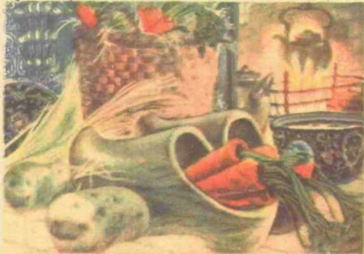
Στό Βέλγιο ξεμερόνοντας του 'Αγίου Νικολάου τά παιδιά βρίσκουν κοντά στα κρεβάτι τους ξελοπάπουτσα γεμάτα με καρμέλλες και γλυκά.

ταξιδιωτών. 'Ο άγιος ό μυροβλήτης, ό εκκλησιαστικός πατέρας που τ' όνομά του τό τιμούν όχι μόνο οι όρθόδοξοι, μα όλόκληρη ή Χριστιανωσύνη.