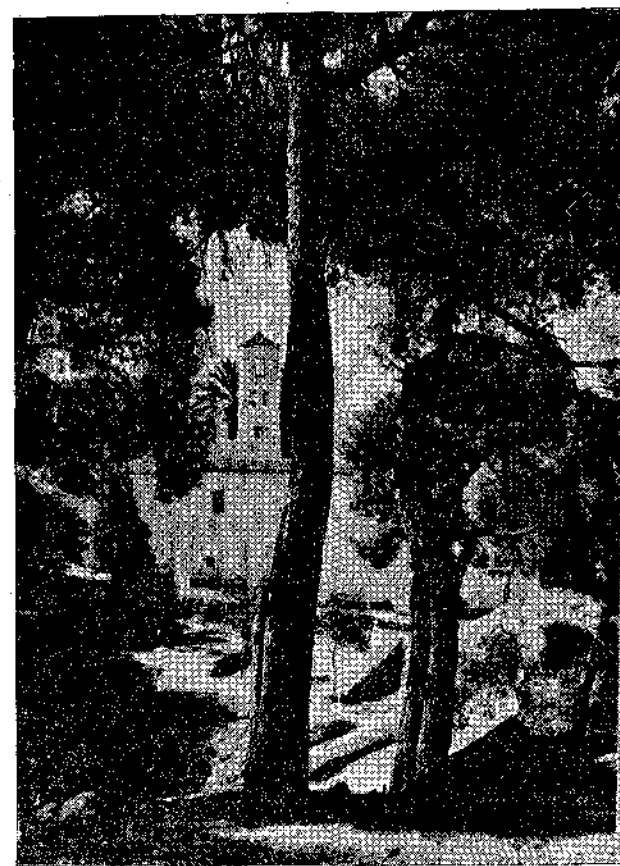
Ἑλληνικὰ τοπία.—Τὸ Μοναστήρι τοῦ Πόρου.

"Ὑστερα ἀπὸ τὴ μπόρα ποὺ τὰ σάρωσε ὅλα, ἔφυγαν ὅλοι ἄρρωστοὶ τραυματίες, γιαιτροί, νοσοκόμες, φορτώθηκαν ὅπως-ὅπως, ἄλλοι σ' αὐτο-