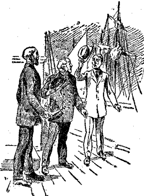
Εικόνα από το νέο μυθιστόρημα «Το ταξίδι της Μιμόδας» που θ' αρχίσει να δημοσιεύεται από το 1ο φύλλο του καινούργιου χρόνου.

Η κυρία Ίφιγένεια συγκινήθηκε κι' άπορησε: — Ποιός σου τ' έμαθε αυτό παιδί μου; ρώτησε. — Ο πατέρας, που σας αγαπάει όλους σας πολύ... Από κείνη τη μέρα, ο Κωστάκης μπήκε στην προστασία της κυρίας Ίφιγένειας. Κι' ο φτωχός κηπουρός έγινε ευτυχισμένος που το παιδί του βρήκε ένα αποκούμπι κοντά στην πλούσια οικογένεια που τη δούλευε μ' όλη την τιμία αποσίωση της καρδιάς του. Όπως η κακιά τύχη δεν ήθελε να συνεχιστεί τούτη η χαρά, ο Πετράκης, άρρωστος βαριά και με την πολλή του φροντίδα, ξεχάστηκε πάλι το φτωχό αγόρι, που λαχταρούσε τώρα να βρισκότανε έστω και μια στιγμή μονάχα σ' αυτόν άρρωστο φίλο του. Κι' άς τον έθερνε. Άς τον χτυπούσε όσο ήθελε.