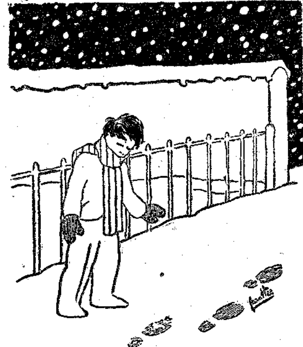
Εικόνα από το νέο μυθιστόρημα «Χόν Φιν» που θ' αρχίσει να δημοσιεύεται από το 1ο φύλλο του καινούργιου χρόνου.

Καμμιά φορά όμως γίνονταν και θαύματα. Πάνω που ο γιατρός έλεγε πως το αγόρι δε θα έβγαζε τη νύχτα, ο πυρετός άρχισε άξαφνα να πέφτει. Τα μάτια του ζωηρέψανε. Και το προσωπάκι του που είχε πάρει την όχρη χλωμάδα του θανάτου, άρχισε σιγά-σιγά να γίνεται χαρούμενο και γελαστό, όπως τον παλιό καλό καιρό που έτρεχε έξω στον κήπο πηδώντας τις άμπολες και τις στέρνες. Η κυρία Ίφιγένεια έκανε το σταυρό της και προσευχήθηκε κι' ο γιατρός τ' έχασε σ' ένα βρόθηξε ξαφνικά μπρός σ' ένα νεκρανάσταση. Έβαλε τα γυαλιά του, τ' ακούπισε με το μαντήλι του, τ' άναφώρεσε κι' έσκυψε προσεχτικά πάνω από το παιδί. — Σώθηκε, είπε ύστερα από λίγο, σώθηκε! Σίγουρα ο Θεός είναι μαζί του! Τα πράγματα μονομιάς άλλαξαν. Η χαρούμενη είδηση κατρακύλησε στο μεγάλο σπίτι. Τήν πήρανε οι