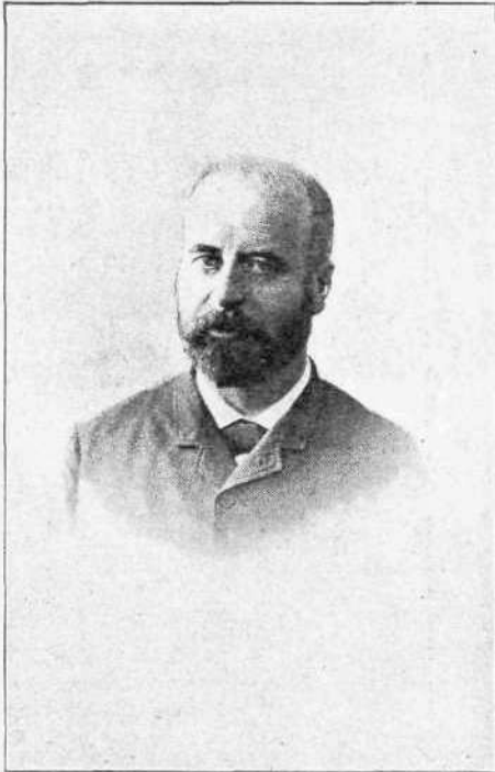
Αιμίλιος Λεφτανδ ὁ ἐν Παρισίοις ἐλληνιστής

μικρὸν ὄν, ὅπερ σκέπτεται. Ἐν τούτῳ ἄς παραμείνωμεν. Ὁ ἐγκέφαλος τοῦ μύρμηκος σκέπτεται καὶ ἐγκλείει κόσμον ὁλόκληρον ἐντυπώσεων, ἰδεῶν, συλλογισμῶν, κρίσεων. Ἴδου τί ἐπιθύμουν κυρίως νὰ ὑποβάλλω εἰς τὴν κρίσιν τῶν σκεπτομένων ἐπίσης ἀνθρώπων.