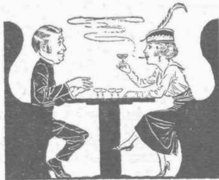
Ἡ σύζυγος: Θυμᾶσαι κάποτε ποῦ μ' ἐζήτησες εἰς γάμον καὶ ἐγὼ ἀπεποιήθην; Ὁ σύζυγος (στενάζων): Ναι, Αὐτὴ εἶνε ἡ Ὠραιότερα ἀνάμνησις τοῦ θίου μου