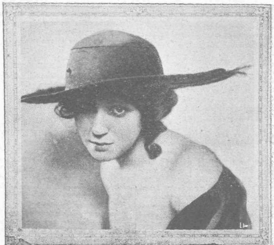
Ἡ χαριτωμένη μίς Κύρλη Βέλλιου, ποῦ χαλάει κόσμον κάθε βράδυ εἰς τὸ θέατρον τοῦ Λονδίνου «Κολίτσιουμ».