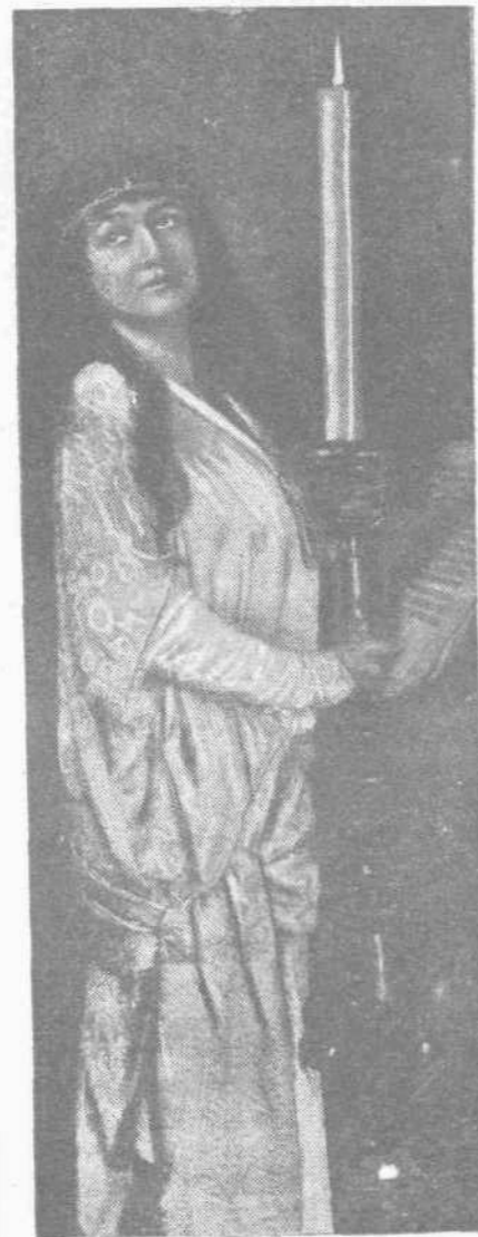
Ἡ μίς Τζούλια Ἀρθορ, ἡ περιώνυμος ἀμερικανὶς ἠθοποιός, ἡ ὁποία παίζει θανμάσια τὸ δυνατόν δράμα «Ἡ Λιωνία Μαγδαληνή».