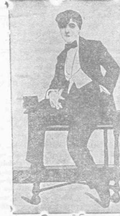
— Αφίτου κανίζω σιγαρέτα «Ατλας»...