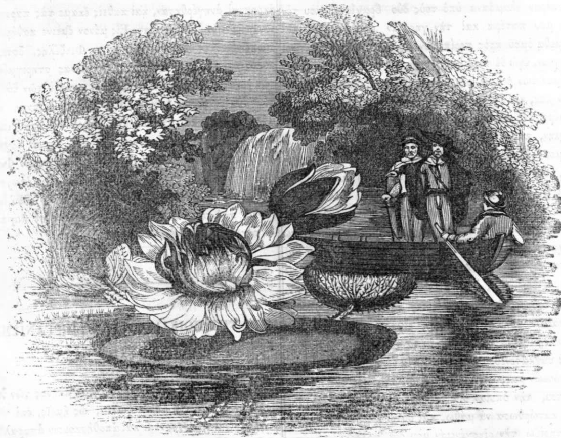
ΕΝΙΔΡΟΝ ΦΥΤΟΝ ΟΝΟΜΑΖΟΜΕΝΟΝ ΒΑΣΙΛΙΣΣΑ ΒΙΚΤΟΡΙΑ.

Ἀνακεφαλαιοῦντες ὡς ἕγγιστα τὸν ἀναλογισμὸν ὧν τῶν ἐπὶ τῆς γῆς καὶ ἐν τῇ θαλάσσει ζῶων καὶ φυτῶν, εὐρίσκωμεν περίπου 2,000,000, διάφορα εἶδη αὐτῶν, χωρὶς ἀριθμῆσωμεν τὰ διὰ τοῦ μικροσκοπίου πανταχοῦ παρατηρούμενα ἀπειράριθμα ἔντομα, τῶν ὁποίων πολλὰ ἄμωδρὰν γινώσκιν ἔχομεν μέχρι σήμερον.