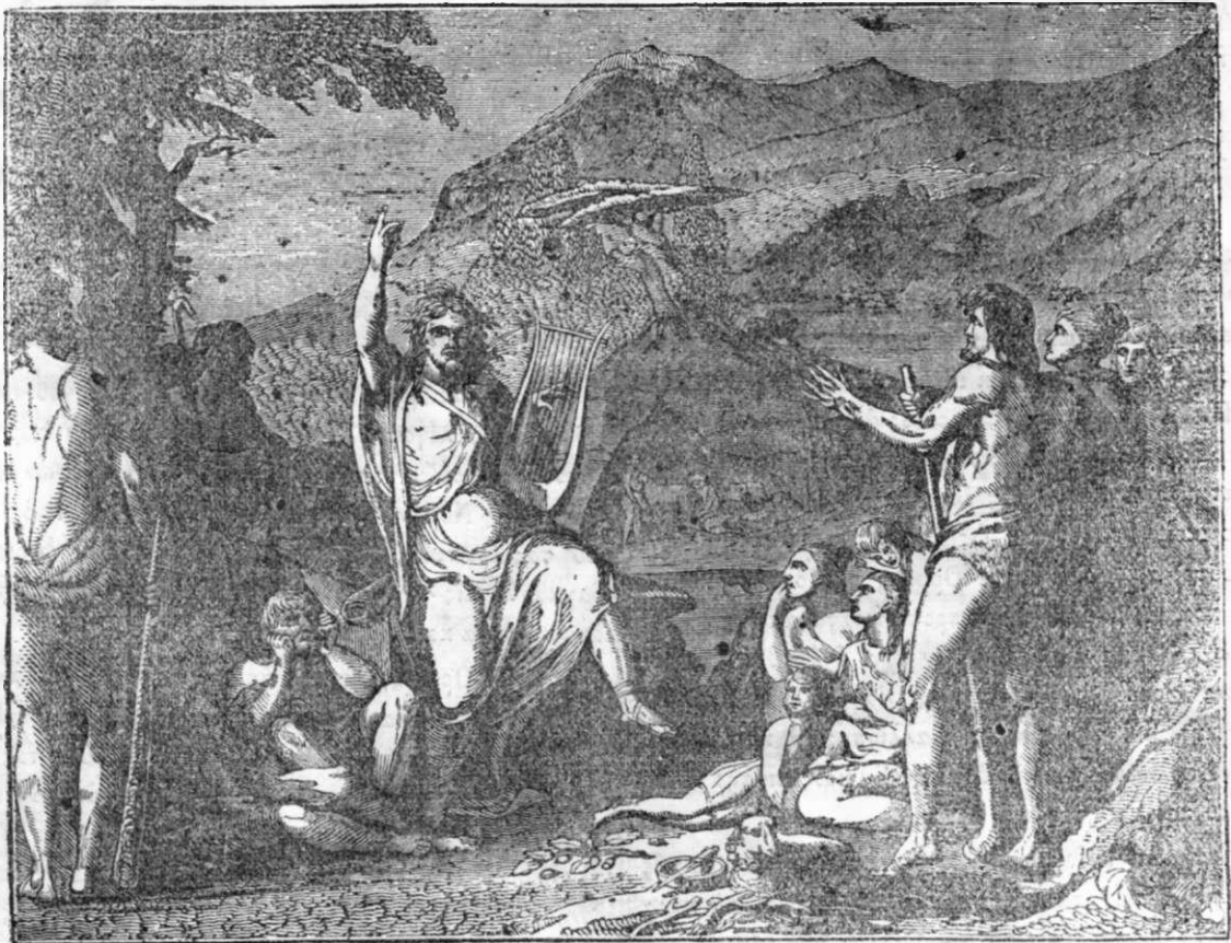
Ο ΟΡΦΕΥΣ ΠΟΛΙΤΙΖΩΝ ΤΟΥΣ ΘΡΑΚΑΣ ΔΙΑ ΤΗΣ ΛΥΡΑΣ ΑΥΤΟΥ.

ΕΙΣ διάστημα ἤδη τριάκοντα καὶ δύο περίπου αἰώνων ἀναφέρεται μὲ σέβας καὶ θαυμασμὸν μεταξὺ ὄλων τῶν πεπολιτισμένων λαῶν, τὸ ἐνδοξὸν ὄνομα τοῦ Ὀρφέως, τοῦ ὁποῦ τὴν εὐκλείαν ἐφάνη σεβόμενος καὶ αὐτὸς ὁ πανθαμάκωρ Χρόνος μάλλον, ἢ παντὸς ἄλλου ἀρχαίου ὀνόματος. Ἄλλ' ὑπῆρξεν ἄρα γε οὗτος πραγματικὸν καὶ ἱστορικὸν πρόσωπον, ἢ μόνον τύπος, καὶ προσωποποίησις τῆς Μουσικῆς τῶν ἀρχαίων Ἑλλήνων; ὁ Ὀρφεύς, ὅστις ἐπολίτισε τοὺς Θράκας διὰ τοῦ ἄσματος αὐτοῦ, ὁ Ὀρφεύς, ὅστις καταβάς εἰς τὸν Ἄδην ἀνάγει ἐκεῖθεν τὴν Εὐριδίκην διὰ τῆς θείας δονήσεως τῆς Μουσικῆς, εἶναι ἄρα γε ὁ αὐτὸς ἐκεῖνος Ὀρφεύς, ὁ συνοδεύσας τοὺς Ἀργοναύτας, ὅτε ἐξεστράτευσαν πρὸς ἀρπαγὴν τοῦ χρυσοῦ δέρατος; καὶ ὁ Ἀργοναύτης Ὀρφεύς εἶναι αὐτὸς ἐκεῖνος ὁ ποιητὴς τῶν Ἱερῶν ὕμνων καὶ ὁ φιλόσοφος ἱερεὺς, παρὰ τοῦ ὁποῦ ὁμολογεῖ ὁ Πλάτων ὅτι παρέλαβε τὰς περὶ ἀθανασίας τῆς ψυχῆς ἰδέας αὐτοῦ; Ἀδυνατοῦμεν νὰ λύσωμεν τοιαῦτα προβλήματα ἐρηνηθεύοντα σοφῶς μὲν, ἀλλὰ διαφόρως καὶ ἀσυμφώνως, ὑπὸ πολλῶν ὀνομαστῶν συγγραφέων λέγομεν ὅμως μετὰ ἀγχνίους τινὲς κριτικοῦ, ὅτι ἦν καὶ αἱ ἀνδραγαθίαι τοῦ Ὀρφέως ὁμοιάζουσι τὴν μυθώδη ἱστορίαν τῶν πρώτων αἰώνων τῆς Ἑλλάδος. περικαλυπτοῦσαν μὲ μυρία ποικίλα κο-