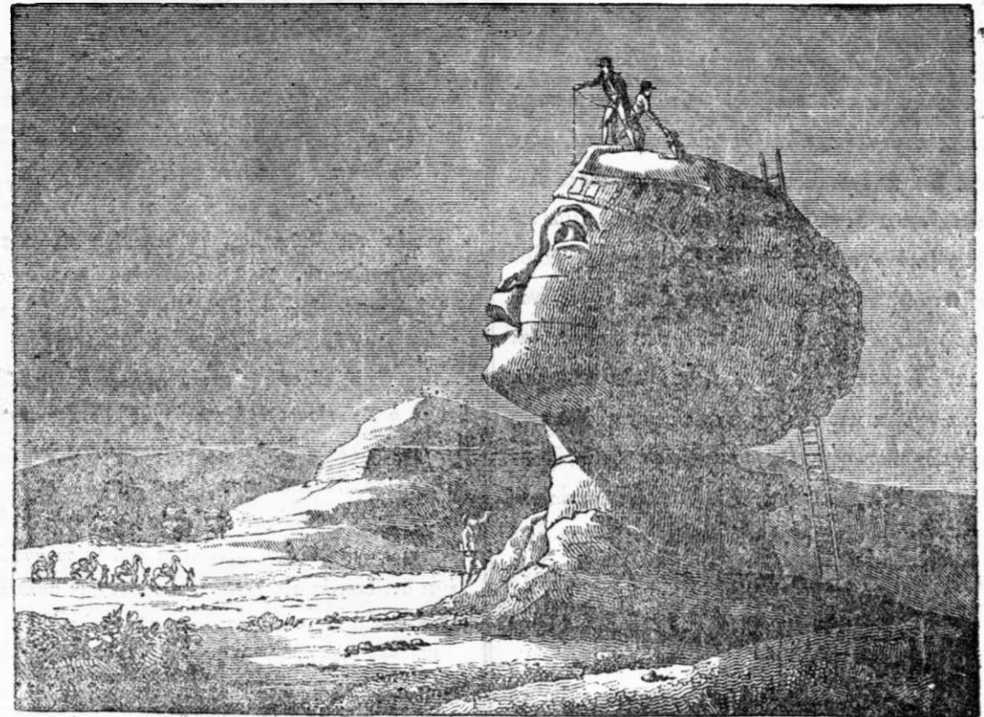
Ἡ Αἰγυπτία Σφίγξ.

Ἡ μὲν Ἑλληνικὴ Σφίγξ μυθολογεῖται ὅτι ἦτο τέρας· ἔχον πρόσωπον μὲν γυναικὸς, στήθος δὲ, πόδας καὶ οὐρὰν λέοντος, πτέρυγας δὲ ὄρνείου, οὔσα θυγάτηρ τῆς Ἐχιδνῆς καὶ τοῦ Τυφῶνος· καθημένη δὲ ἐπὶ τοῦ Φικεΐου, ὄρους τῆς Βοιωτίας, ἐπρόβαλλεν εἰς τοὺς ἐκείθεν