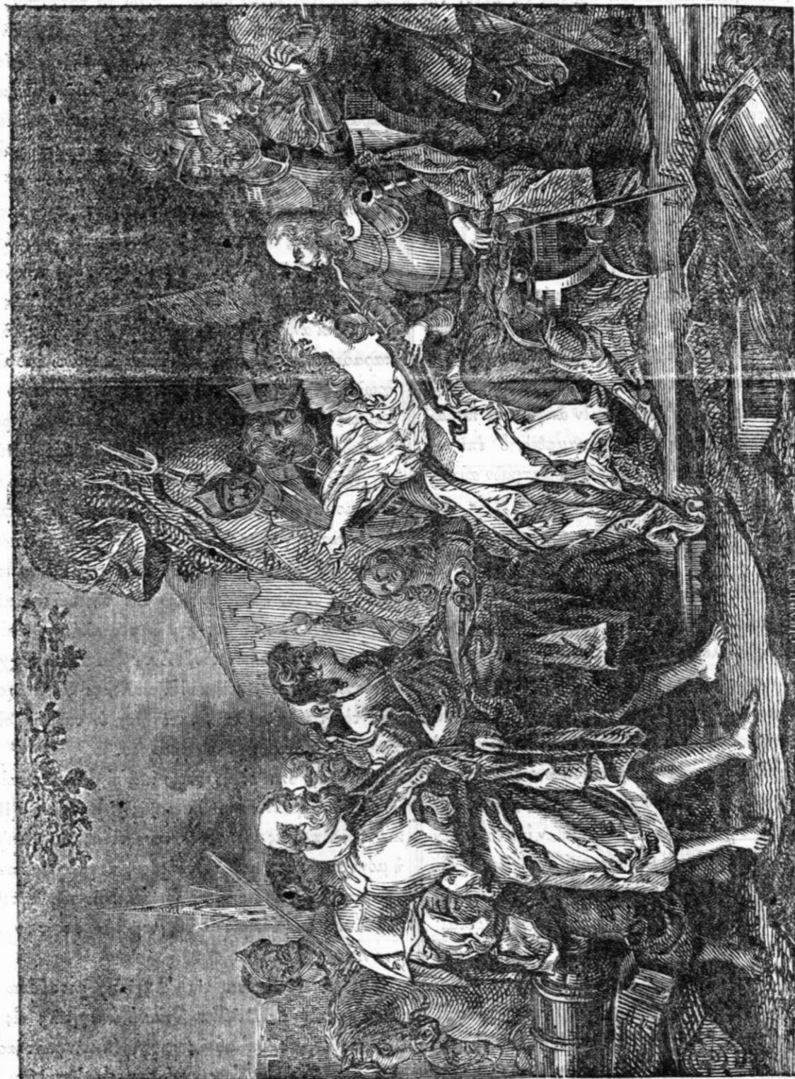
ΦΙΛΟΠΑΤΡΙΑ ΤΟΥ ΕΥΣΤΑΘΙΟΥ ΣΑΙΝΠΙΕΡΟΥ.

Καὶ ὁ μὲν Φίλιππος ἔχων ὑπὲρ ἑαυτοῦ τὸν Σαλικὸν νόμον, τὸν ἀποκλείοντα τῆς διαδοχῆς τοῦ θρόνου τὰς γυναῖκας, καὶ προκριθεὶς τοῦ Ἐδουάρδου, ἐστέφθη Βασιλεὺς τῆς Γαλλίας. Ἄλλ' ὁ Ἐδουάρδος, ἡγούμενος πολυαρίθμου στρατιᾶς εἰσέβαλεν εἰς τὴν Γαλλίαν, καὶ μετὰ φονικὴν μάχην πλησίον τοῦ Κρεσῦ, κατέστησε πολιορκίαν εἰς τὴν πόλιν Κάλητον (Calais) καὶ ἠπέλει τὸν φρούραρχον αὐτῆς Ἰωάννην Βιέννον, ὅτι ὡς νόμιμος Βασιλεὺς τοῦ θρόνου τῆς Γαλλίας θέλει δια-