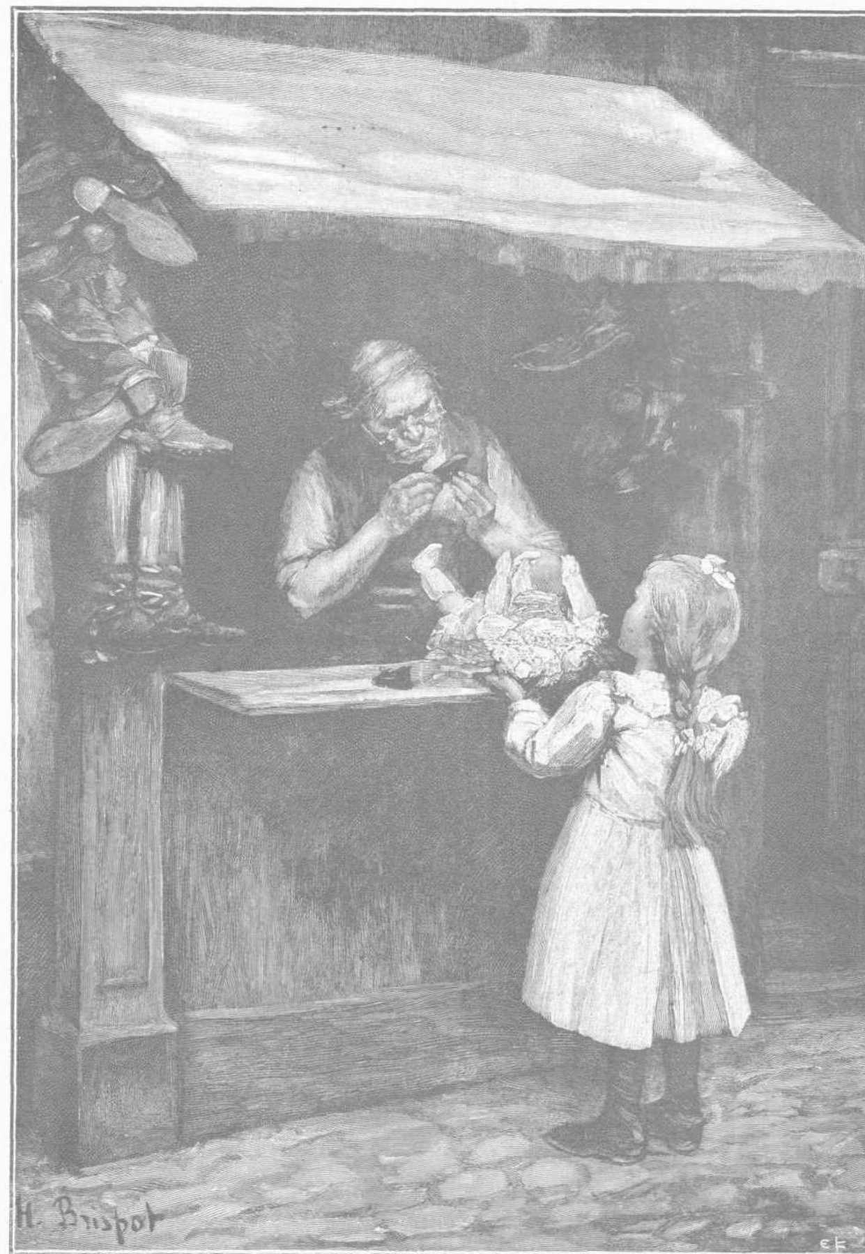
ΤΟ ΠΑΠΟΥΤΣΑΚΙ ΤΗΣ ΚΟΥΚΛΑΣ