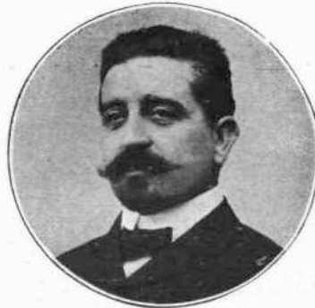
Ν. ΤΡΙΑΝΤΑΦΥΛΛΑΚΟΣ Υπουργός τῶν Ἐσωτερικῶν.