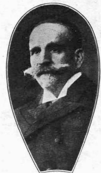
ΑΘ. ΕΥΤΑΪΔΙΑΣ Υπουργός τῆς Ἐθν. Οικονομίας.