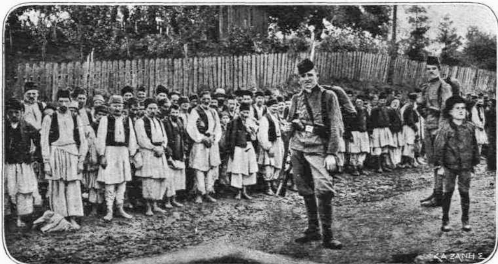
ΑΠΟ ΤΑ ΑΥΣΤΡΟ-ΣΕΡΒΙΚΑ. — Εις την Κρέκα, πλησίον της Τούζλας, οι Αυστριακοί ήμαλσώσαν...