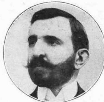
Ν. ΣΤΡΑΤΟΣ Υπουργός τῶν Ναυτικῶν.