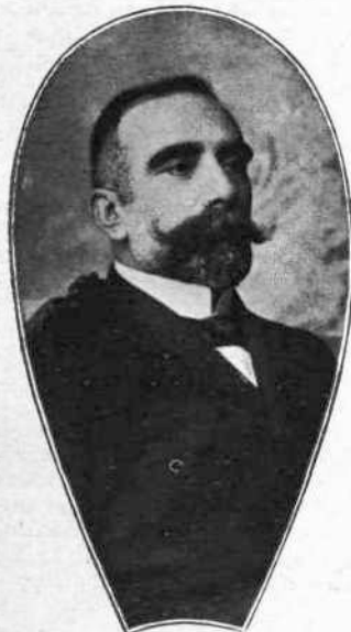
ΧΑΡ. ΒΟΖΙΚΗΣ Υπουργός τῆς Δημ. Ἐκπαίδευσως.