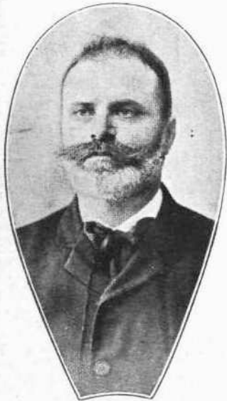
Ν. ΠΡΩΤΟΠΑΠΑΔΑΚΗΣ Υπουργός τῶν Οικονομικῶν.