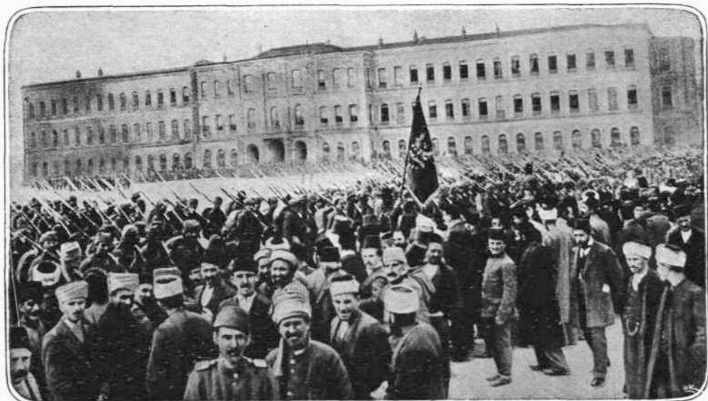
ΑΠΟ ΤΗΝ ΕΜΠΟΛΕΜΟΝ ΤΟΥΡΚΙΑΝ — Διαρκώς συγκεντρώνται στρατός εις την Κων/πολιν από τας επαρχίας...