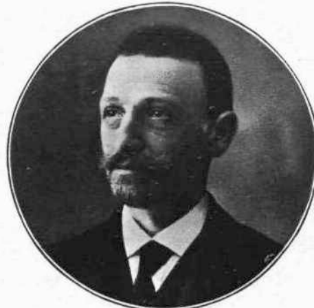
ΔΗΜ. ΓΟΥΝΑΡΗΣ Πρωθυπουργός - Υπουργός τῶν Στρατιωτικῶν.