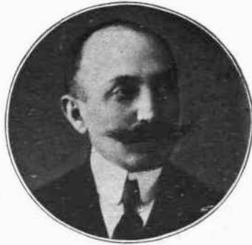
Π. ΤΣΑΛΔΑΡΗΣ Υπουργός τῆς Δικαιοσύνης.