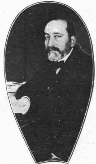
Γ. ΧΡ. ΖΩΓΡΑΦΟΣ Υπουργός τῶν Ἐξωτερικῶν.