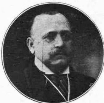
Γ. ΜΠΑΛΑΤΖΗΣ Υπουργός τῆς Συγκοινωνίας.