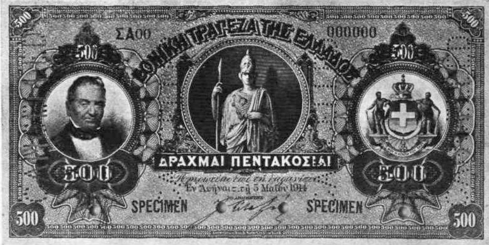
ΠΡΟΣ ΓΝΩΣΙΝ ΣΑΣ. — Η Έθνική Τράπεζα έθεσεν έσατός εις κυκλοφορίαν νέα πεντακοσιόδραγμα. Τό παρατιθέμενον άντίτυπον έφατογραφήθη εις τά 2/3 τού πραγματικού.

Πρόκειται περί τού Εθρωπαϊκού πολέμου. Εις τήν Γερμανίαν οι τραπεζίται Στρόμπελ έκαμαν άπό πέρσι υπολογισμούς, οι όποιοι και έδημοσιεύθησαν άπό τό Γερμανικόν Έπιτελεϊον. Υπολογίζουν τήν δαπάνην δι' έκαστον Γερμανόν στρατιώτην καθ' έκάστην εις δωδεκάμιση φράγκα ή δεκαπέντε φράγκα. Άλλοι όμως τήν δαπάνην αύτήν τήν αναθεάζουν μόνον εις επτάμιση φρ. Τήν διάρκειαν τού πολέμου υπολογίζουν εις έτος περίπου. Μέσον όρον μαχητών Γερμανών λαμβάνουν τρία έκατομύρια. Και άπό τήν τριπλήν αύτήν βάσιν όρμώνενοι φθάνουν μαθηματικώτατα εις τό κολοσσ