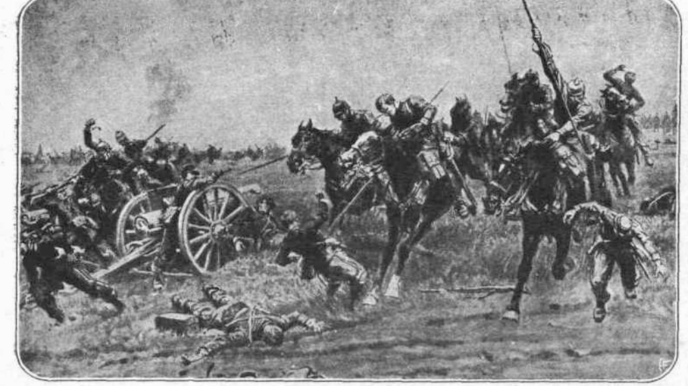
ΕΙΣ ΤΟ ΥΠΡ.—Ἀπόσπασμα ἱππικοῦ Γερμανῶν ἐπελάσαν ἀτρόμητον κατ' ἐξερρευομένης ἀπαύσεως...