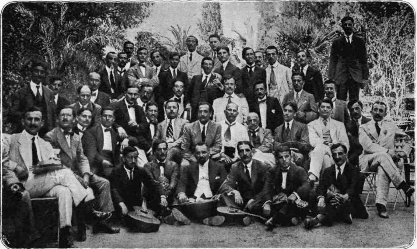
ΝΕΟΣ ΣΥΝΔΕΣΜΟΣ. — Οί συντάκται των καθημερινών Άθηναϊκών έφημερίδων έπηξαν και αυτοί επί τέλους τό σωματείον των και τό γεγονός τό έπαινήρισαν με ένα εύθυμώτατον γεύμα είς την γοητευτικήν Ήσουλιν Θών, τό όποιον έπιαφράγισεν ή συμμετοχή μουσικού όμίλου της «Μουσικής Ακαδημίας».

Τί δέ νά είπωμεν περί κάποιων άλλων, τούς όποιους ό έκ Μάντσεστερ διελθών άντιπρόσωπός μας σημείει ώς «άγνώστου διαμονής»; Δηλαδή δέν άρκει ότι μάς κατεχράσθησαν από 22 φρ. έκαστος, αλλά και άναχωρήσαν-