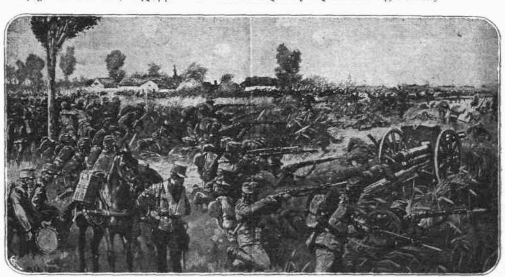
Η ΠΡΟΕΛΑΣΙΣ ΤΩΝ ΑΥΣΤΡΟΓΕΡΜΑΝΩΝ.—Εἰς ἓνα ἐπιπέδιον τοῦ Ἀνατολικοῦ μετώπου οἱ Ἀυτρογερμανοὶ προήλασαν...