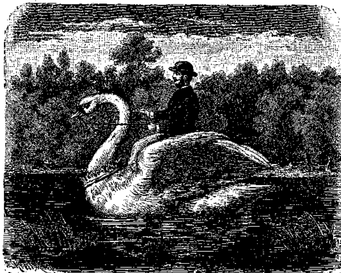
Ποδήλατον διὰ ξηρᾶς καὶ θαλάσσης.