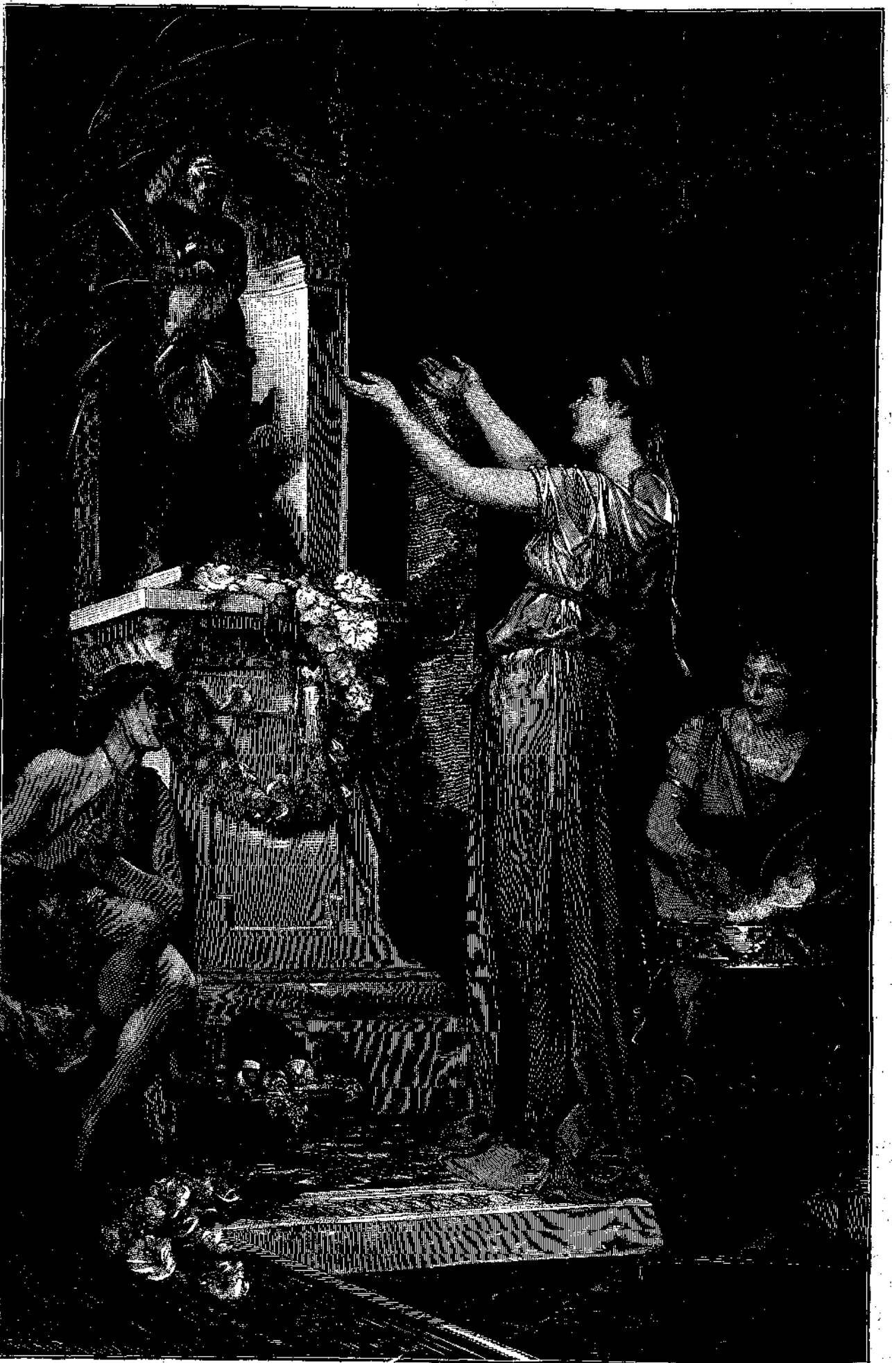
ΡΩΜΑΙΑ ΠΡΟΣΦΕΡΟΥΣΑ ΓΑΜΗΛΙΑΝ ΘΥΣΙΑΝ. Κατὰ τὴν εἰκονογραφίαν τοῦ Fritz Schneider.

Καὶ ἤρχισε πάλιν ὁ καλούμενος Δαμιανὸς νὰ γελά τὸν ἀλλόκοτόν του γέλωτα καὶ ἐκτύπησε πάλιν μετὰ τὴν παλάμην τὸ ἰσχίον του. Ἐπειτα ἐξήγαγε μανδύδιον, ἐζωγραφημένον μετὰ κόκκινα τετράγωνα, ἐκαθάρισε βροντωδῶς τὴν βίνα του, ἐν ᾧ οἱ ὀφθαλμοὶ του ἀρίως περι-