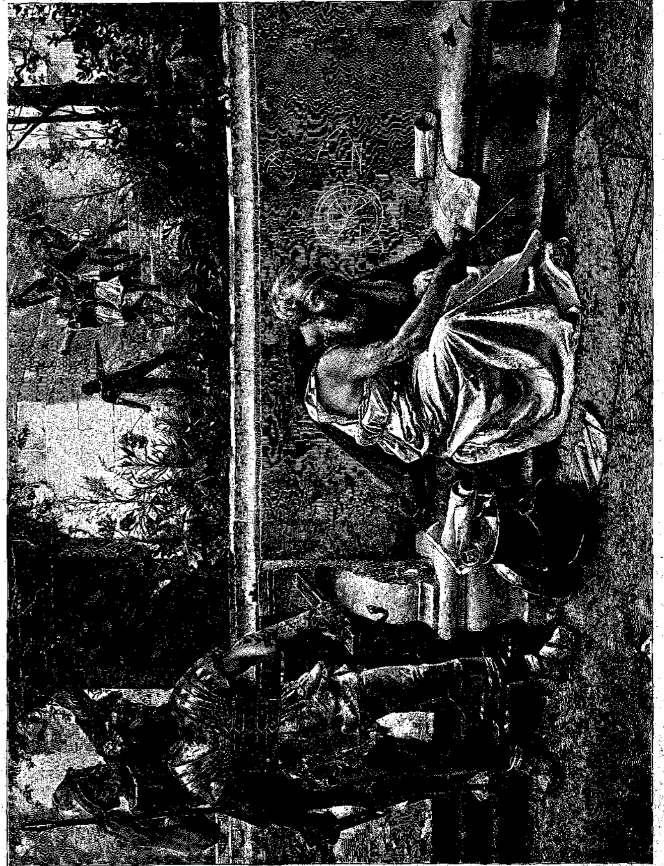
Ο ΑΡΧΙΜΗΔΗΣ Εἶκον ὑπὸ Gust. Courtois.

Ἀπαράμιλλως δὲ μεγαλοπρεπῆς ἐγένετο ἡ τελετὴ τοῦ Παπικοῦ ἰωβιλαίου τῇ 29. του Δεκεμβρίου 1887. Ὁ Λέων ΙΓ' ἀθέατος συνήθως εἰς τὸ πολὺ δημόσιον, κατήλθεν ἐκ τοῦ Βατικανοῦ εἰς τὴν ἐκκλησίαν τοῦ ἁγίου Πέτρου, ὅπως λειτουργήσῃ εἰς ἀνάμνησιν τῆς πρὸ πεντηκονταετίας πρώτης Ἱερᾶς λειτουργίας αὐτοῦ, ὁ ἀπέραντος δὲ οὗτος ναός, ὁ μέγιστος τῶν ναῶν τοῦ χριστιανικοῦ κόσμου, ὑπὲρ τὰς 50 χιλιάδας ἀνθρώπων ὑπερχειλίσει ἐκ τοῦ ἀπὸ πάσης γῆς συβρέυσαντος πλήθους· εἰς ἴδιον θεωρεῖον κατέλαβον θέσιν οἱ