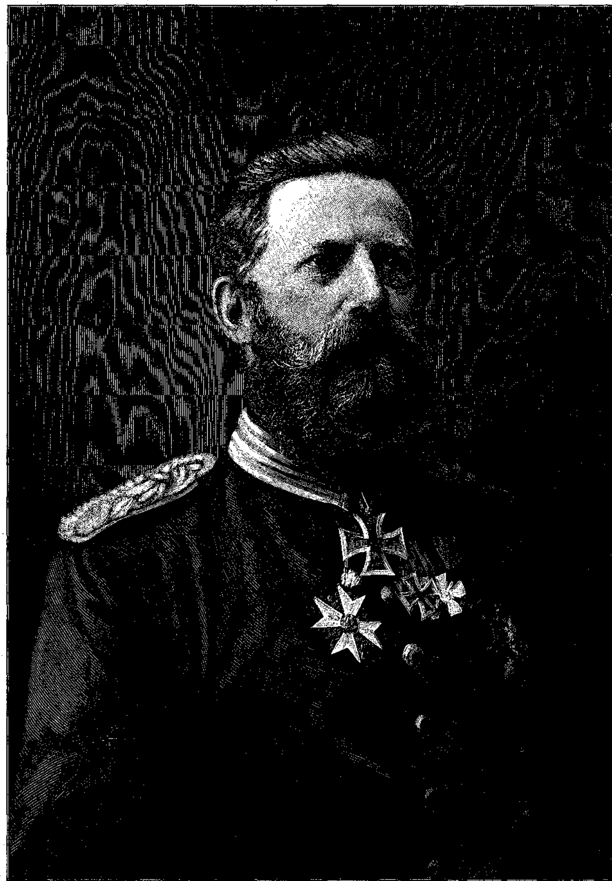
† ΦΡΕΙΔΕΡΙΚΟΣ Γ'. ΑΥΤΟΚΡΑΤΩΡ ΤΗΣ ΓΕΡΜΑΝΙΑΣ.

Οὕτω π. χ. ὁ Ῥωμαῖος ποιητὴς Ίουβενάλης ἀναφέρει, ὅτι ὁ μέγας ποιητὴς Ὀράτιος δὲν ἠδύνατο ποτὲ ἄλλως νὰ στιχορρογῇ εἰ μὴ ἰστάμενος ἐπὶ τοῦ ἐνὸς ποδός. Γνωρίζομεν ὡσαύτως ὅτι ὁ Γάλλος Mourger μόνον τὴν νύκτα ἠδύνατο νὰ συγγράφῃ, ὅτι ὁ Nestroy μόνον ἐν τῇ κλίνῃ ἦτο εἰς θέσιν νὰ γράφῃ τοὺς ἀπαραμίλλους καὶ μέχρι τῆς σήμερον ἀνεπίκτους μίμους του (farces), ὅτι ὁ Φερδινάνδος Ραϊμούνδος ἀνερχεῖτο ἐπὶ τῶν δένδρων, ἵσάκις ἠσθάνετο ἐπιθυμίαν νὰ συγγράφῃ καὶ ὅτι ὁ Φερδινάνδος Sauter, ὡσαύτως Βιενναῖος ποιητὴς, μόνον ἐν τῷ ξενοδοχείῳ, παρὰ τῷ οἴνῳ ἠδύνατο νὰ στιχορρογῇ, καὶ εἶχε μάλιστα τὴν συνήθειαν νὰ γράφῃ τὰς ποιητικὰς ἐκχύσεις τῆς ψυχῆς του ἐπὶ