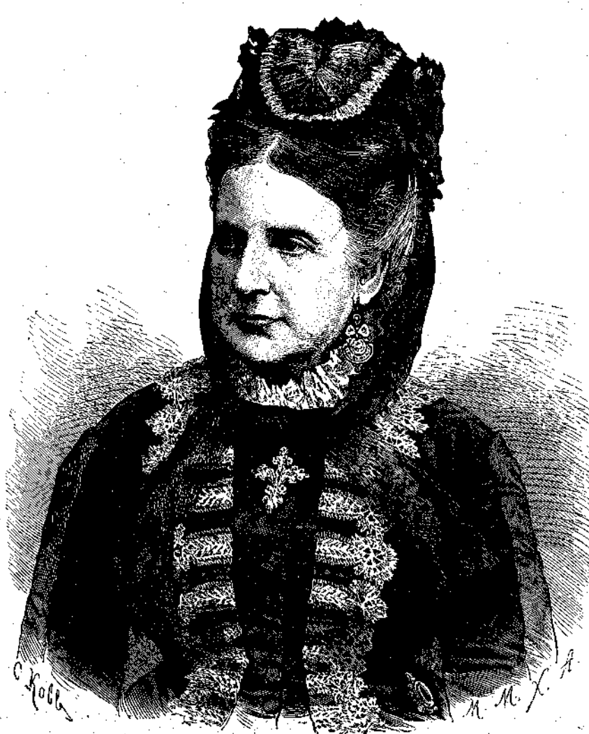
ΚΑΗΜΕΝΤΙΝΗ, Πριγκίπισσα τοῦ Κοβοῦργου.

προσεδοκᾶτο ἡρεμος ἀμα καὶ προοδευτικῆ, ἐδραζομένη ἐπὶ τῆς εἰρήνης καὶ τῆς ἐν τάξει ἐλευθερίας. Ὁ κληρὸς δ' ὅστις ἐτάσσεται αὐτῷ ὑπὸ τῆς ἀπατηλῆς προσμειδώσεως μοίρας, νὰ πρυτανεύσῃ τῶν εὐρωπαϊῶν ἡγεμόνων διάδοχος τοῦ γεραροῦ Γουλιέλμου γενόμενος ἐπὶ τοῦ χαλυβδίνου πρωσσικοῦ θρόνου, ἦν ἀληθῶς ζηλευτός, καὶ ὅσον ἄξιος τόσον καὶ μακάριος ἐθεωρεῖτο πρὸ ἐνικουτοῦ μόλις ὁ τῆς μοίρας ἐκλεκτός.