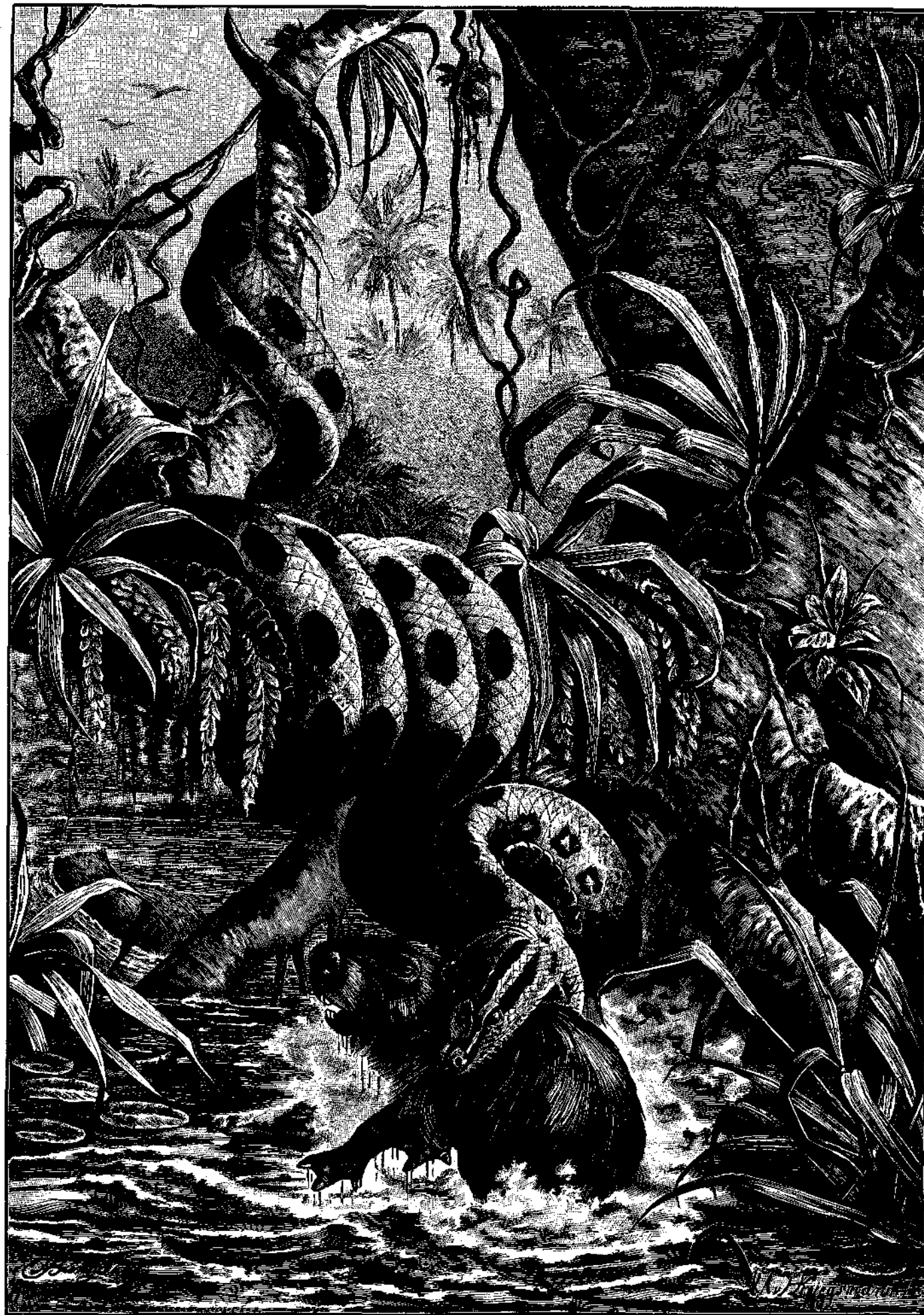
ΓΙΓΑΝΤΙΑΙΟΣ ΟΦΙΣ (ΑΝΑΚΟΝΔΑ) ΣΥΛΛΑΜΒΑΝΩΝ ΥΔΡΟΧΟΙΡΟΝ.

„Ἐρχεσαι ἀπὸ τοῦ Τραμοντάνα“, ἀνεφώνησεν. „Ἐπρεπε νὰ τῆς εἴπῃς ὅτι εἶμαι πολὺ ἄρρωστος. Πρέπει ν' ἀποκόψῃς αὐτὸν τὸν νοσηρὸν. . . αὐτὴν τὴν νοσηρὰν ἰδιοτροπίαν. Δὲν