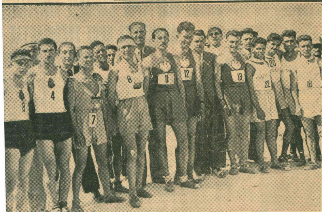
Δρομείς, οί οποίοι ἔλαβον μέρος εἰς τὸν Μαραθῶνιον δρόμον, συγκεντρούμενοι ὀλίγον πρὸ τῆς συγκεντρώσεώς των.