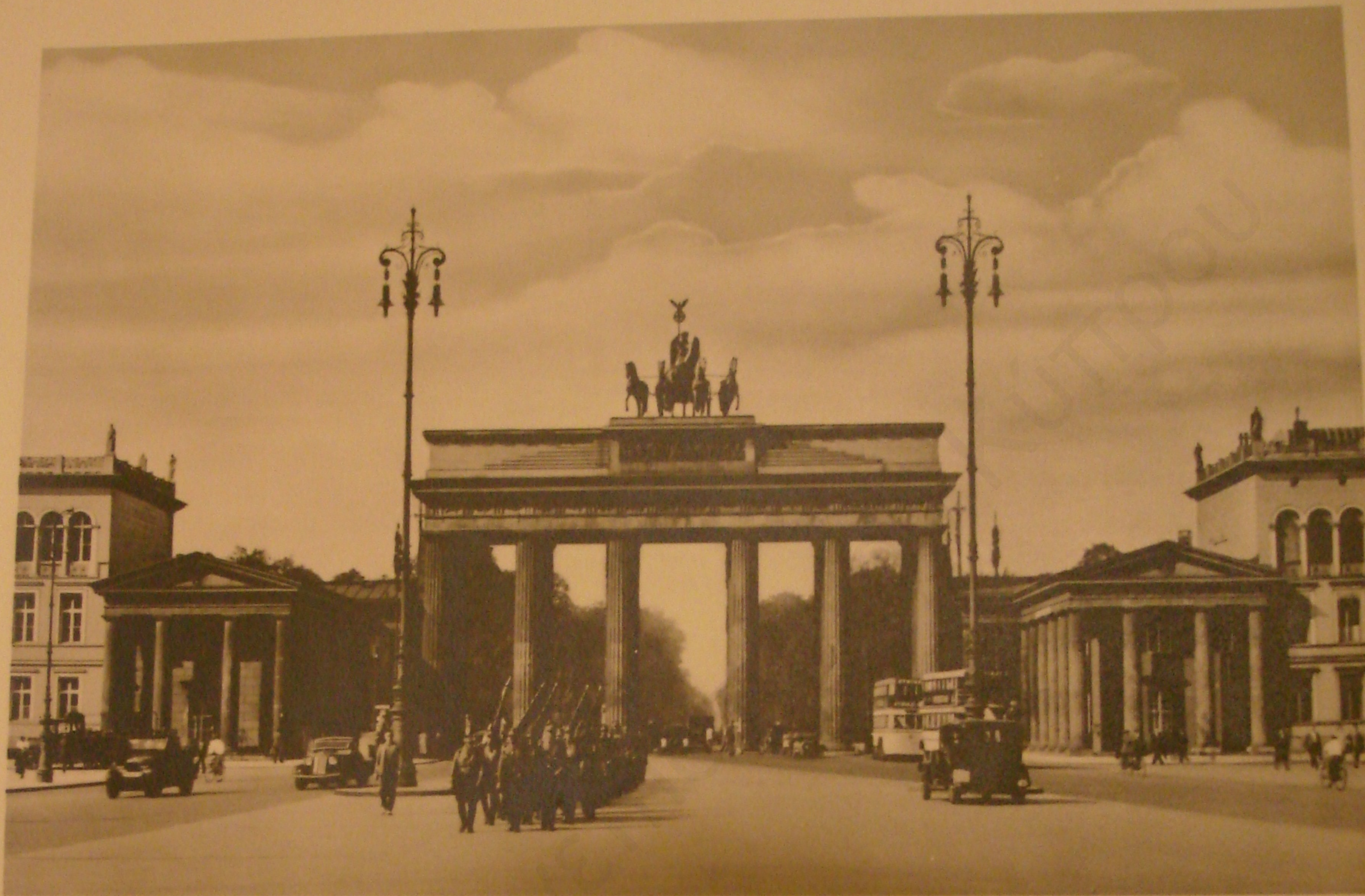
Brandenburger Tor, Berlin