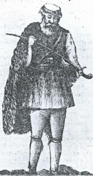
...τρος τους ιππότες των οθωών: Τρεις σπάνιες γραβού- του είχε γίνει πρώτη σελίδα με την απαγωγή του βου- ΚΟΥΣ που έγραψαν ιστορία στα ελληνικά βουνά. Εδώ