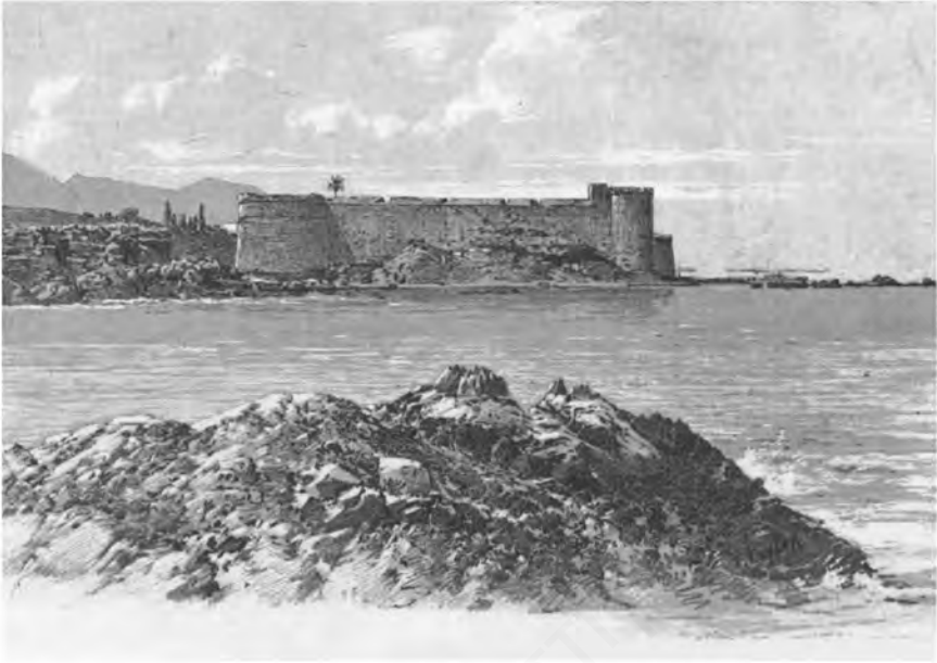
Η ανατολική πλευρά του φρουρίου της Κερύνειας, το τέλος του 19 ου αιώνα (σχέδιο Taylor από το περιοδικό Le Tour du Monde , τχ. 40, 1897).