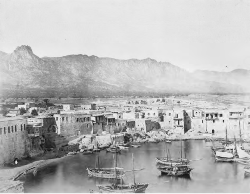
Η Κερύνεια της Κύπρου με το λιμάνι και την κορυφή του Αγίου Ιλαρίωνα στα νοτιοδυτικά της, όπως ήταν γύρω στο 1880.