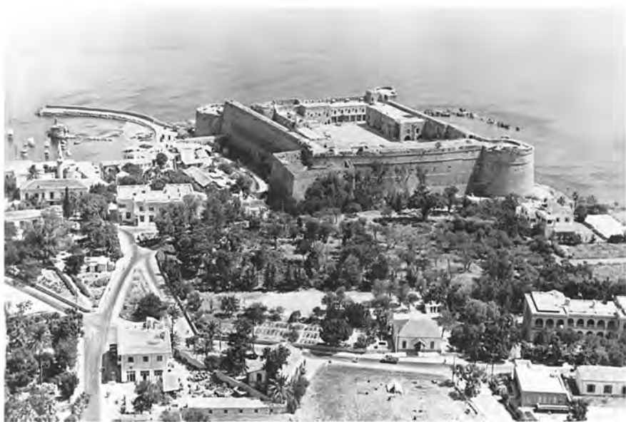
Αεροφωτογραφία του ανατολικού μέρους της Κερύνειας από παλιά κάρτα της δεκαετίας του 1950, με το κάστρο να δεσπόζει και στα αριστερά το λιμάνι της.