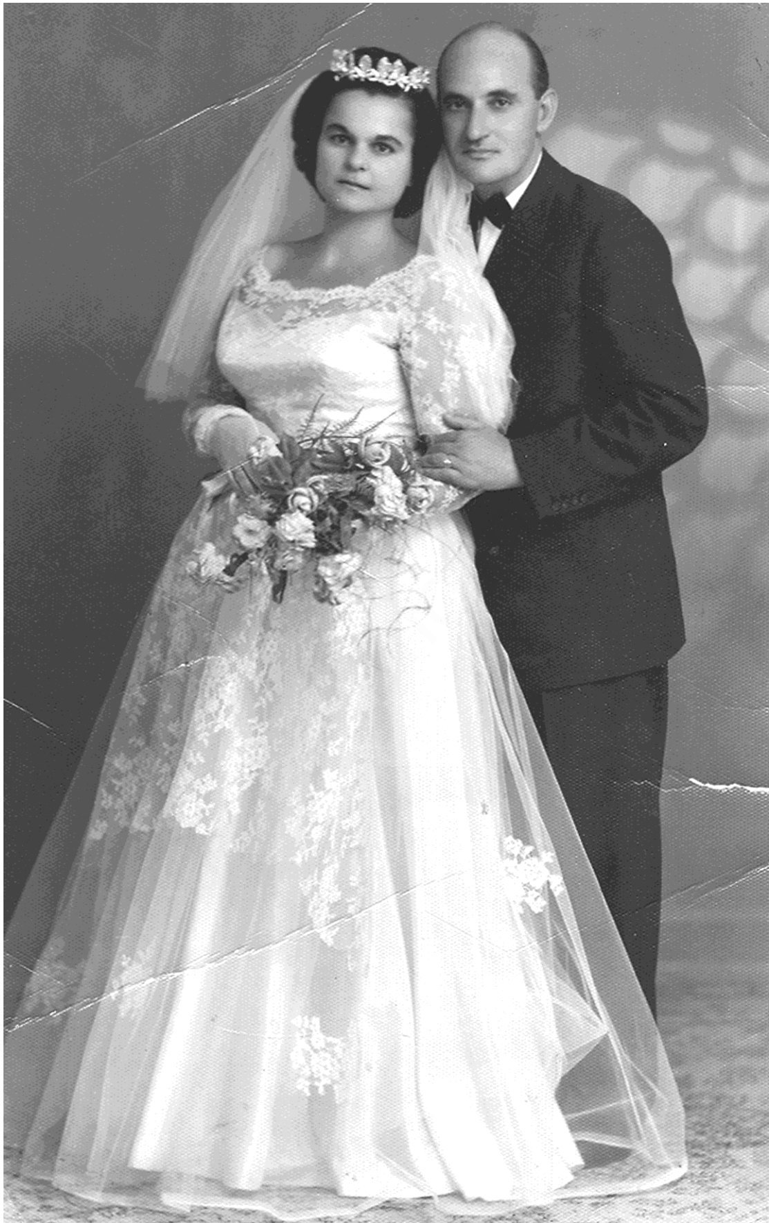
10 Νυφικά της Ιουλίας Πατσαλίδου, για τις Έλλη Μουστάκα (1963) και Λούλα Κρασιδιώτου (1967).